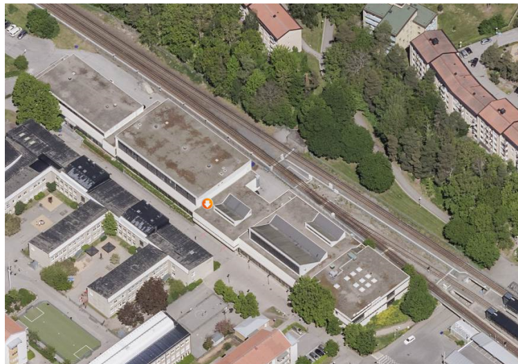
Ortofoto dpMap över Vällingby sim- & idrottshall

Fastighetskontoret Fastighetsavdelningen