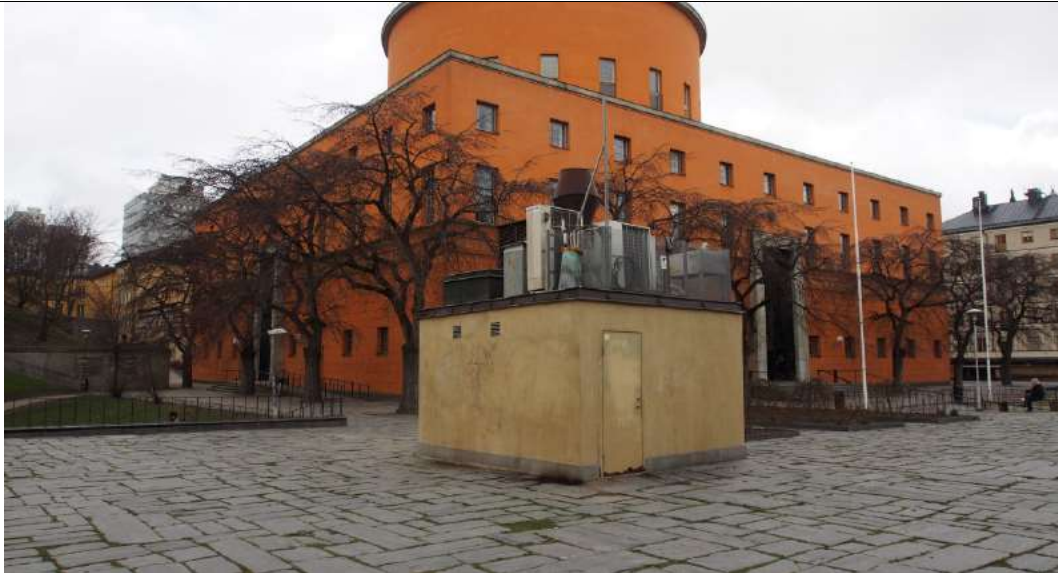
Bild på befintligt skick södra terrassen