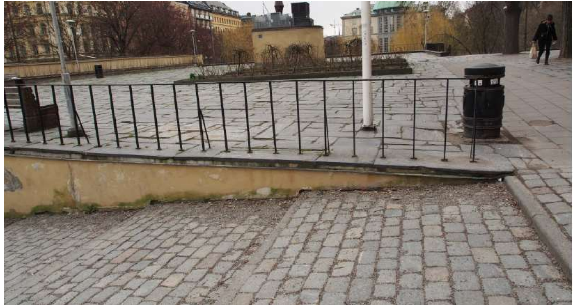
Lägesbild på räcken vid åsnetrappan samt södra terrassen