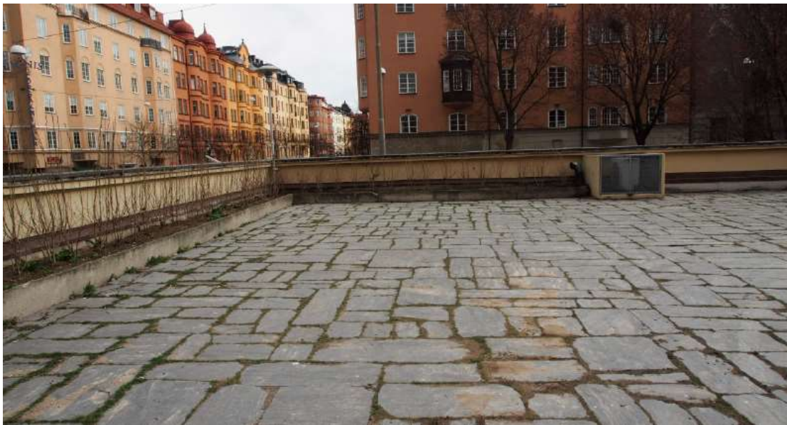
Bild befintligt skick norra terrassen