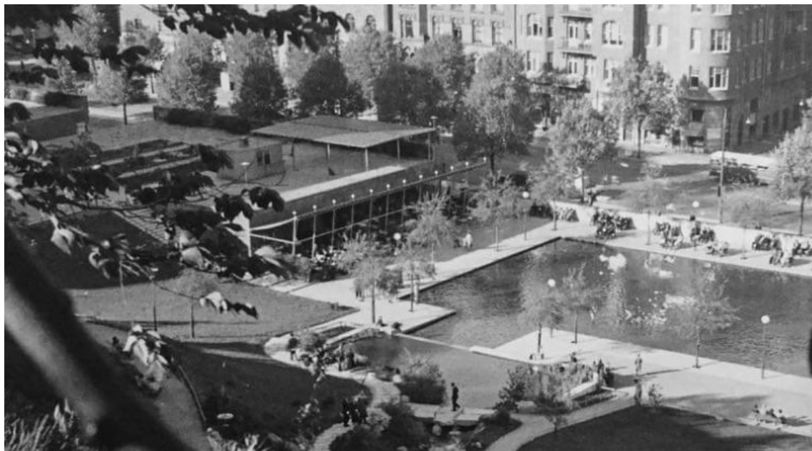
Historisk bild sett från Observatorielunden, troligtvis tagen kring 1945