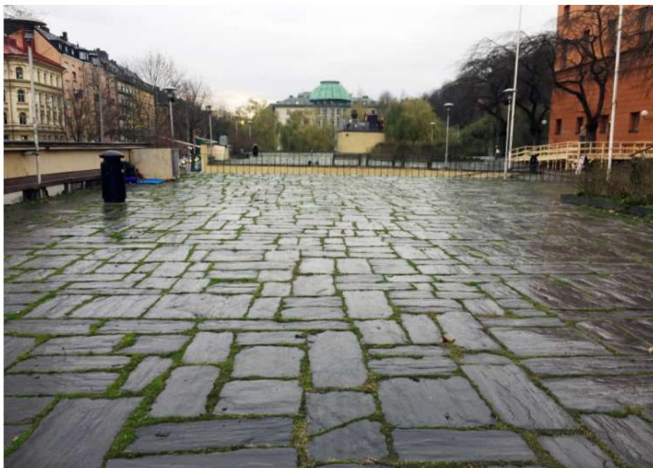
Lägesbild tagen från norra delen av terrasserna

Dessutom så uppfyller inte idag de utvändiga räcken kring Stadsbiblioteket de krav som finns på barnsäkerhet. De har idag en höjd mellan 800-900 högt, samt öppningar i räcket som överstiger 100mm. Detta gör att det finns risk för barn att kan fastna i räcket eller råka ut för fallskador.