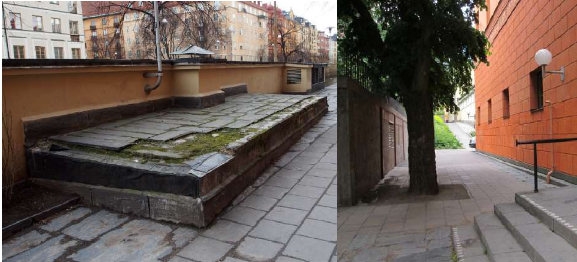
Lägesbild intill Entrén Odengatan, samt passage utanför barnens entré/bibliotek