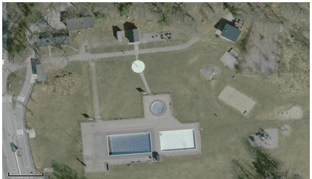
Flygbild över Älvsjöbadet.