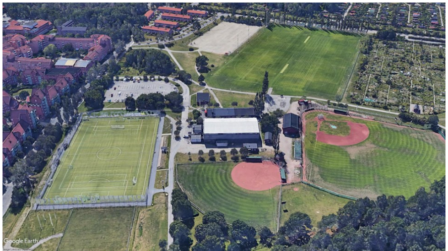
Skarpnäcks sportfält