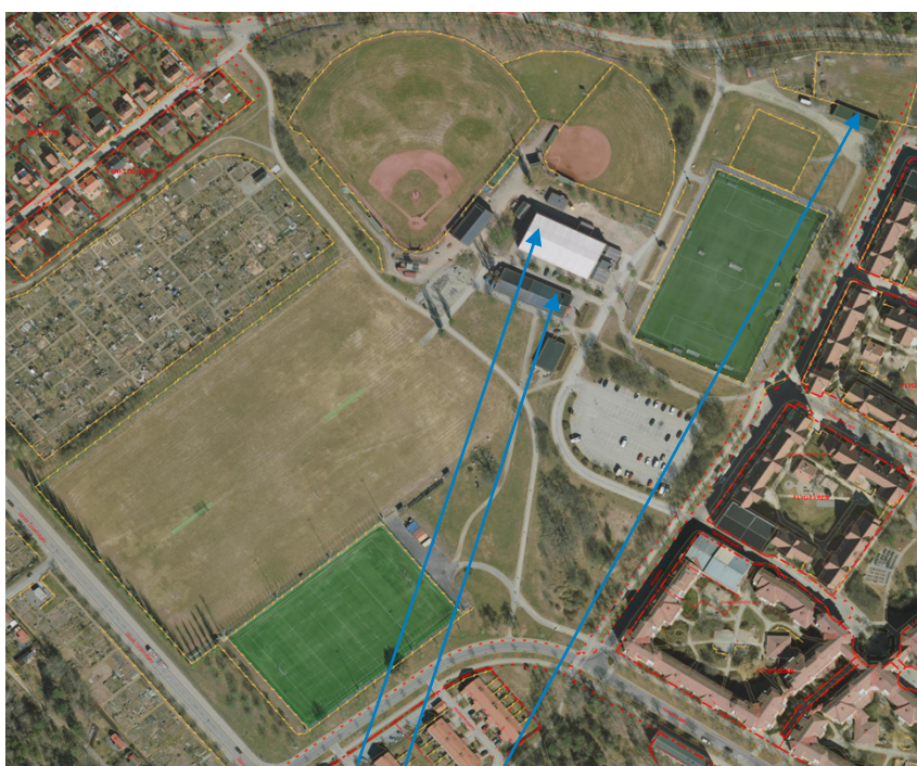
Skarpnäcks sportfält

Skarpnäcks sportfält är en välbesökt idrottsanläggning om ca 132000 kvm mark, fördelat på grönytor, verksamhetsytor, kommunikationsytor, funktioner och byggnader. På utomhusytorna bedrivs allehanda idrotter som rugby, cricket, australisk fotboll, baseboll, softball, agility med mera.