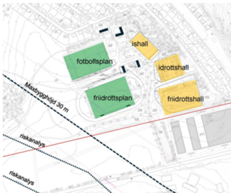
Dispositionsskiss 2016 (underlag markanvisning 2017)

Den planerade idrottsplatsen omfattade vid markanvisning 2017 flera nya byggnader koncentrerade invid Bällsta gård.