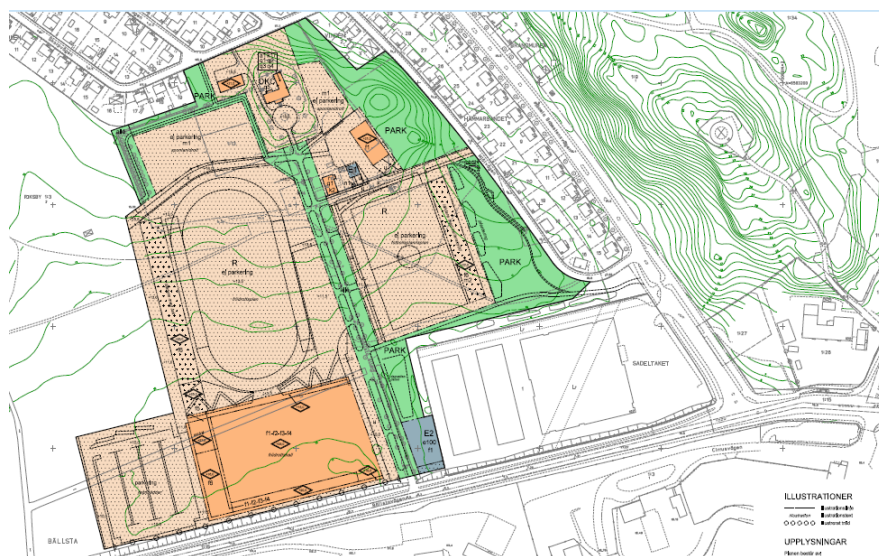
Förslag detaljplan november 2020

Alltför hög exploatering med hänsyn till befintliga bostäder har efterhand krävt att idrottsområdet har förskjutits från befintlig bebyggelse och därmed nödgats minska i omfattning, samt att nya höga byggnader placerats på avstånd till befintlig småhusbebyggelse. Med anledning av detta har idrottsanläggningarnas placering flyttats om. Detta har resulterat i den nu föreslagna placeringen av fotbollsplan mot småhusbebyggelse och friidrottshall utefter Bällstavägen.