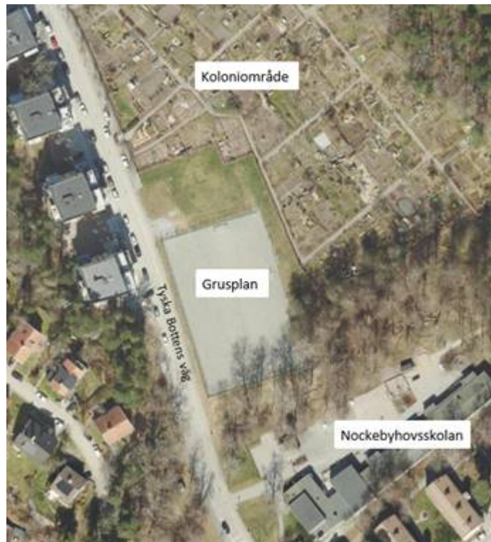
Kartbild över Nockebyhovs BP

Nockebyhovs BP ligger inom Bromma stadsdelsnämndsområde nära Nockebyhovsskolan. Den består idag av en 7-spels grusplan med stängsel längs med båda kortsidorna och långsidan som vetter ut mot Tyska Bottens väg. Intill bollplanen inom idrottsområdet finns en gräsyta som inte nyttjas.