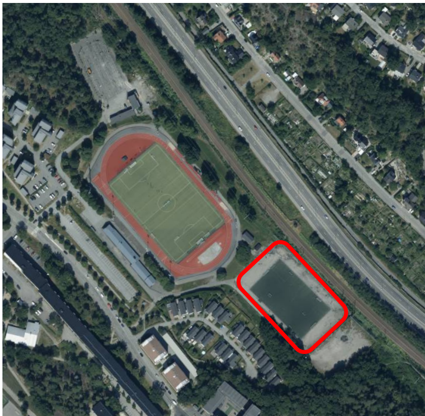
Översiktsbild, röd markering visar placering av ny konstgräsplan.

läktare. Bollplanens entré för aktiva och driftpersonal placeras vid den norra kortsidan i riktning mot övriga idrottsplatsen.