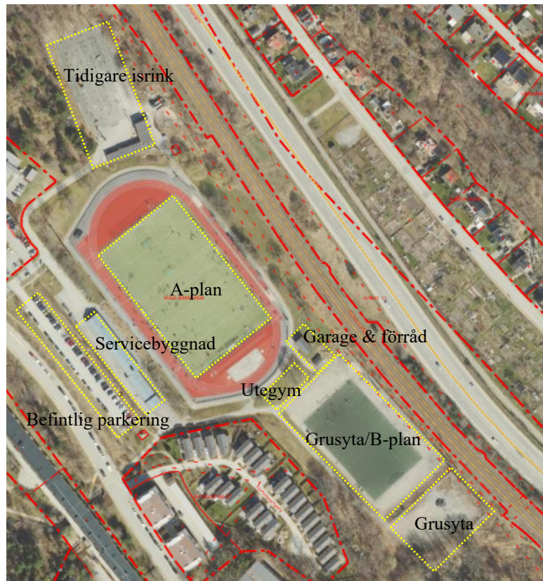
Översiktsbild på befintliga funktioner på Hagsätra IP.