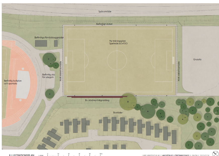
Illustrationsplan som visar placering av den nya bollplanen.

Fastighetskontoret Fastighetsavdelningen