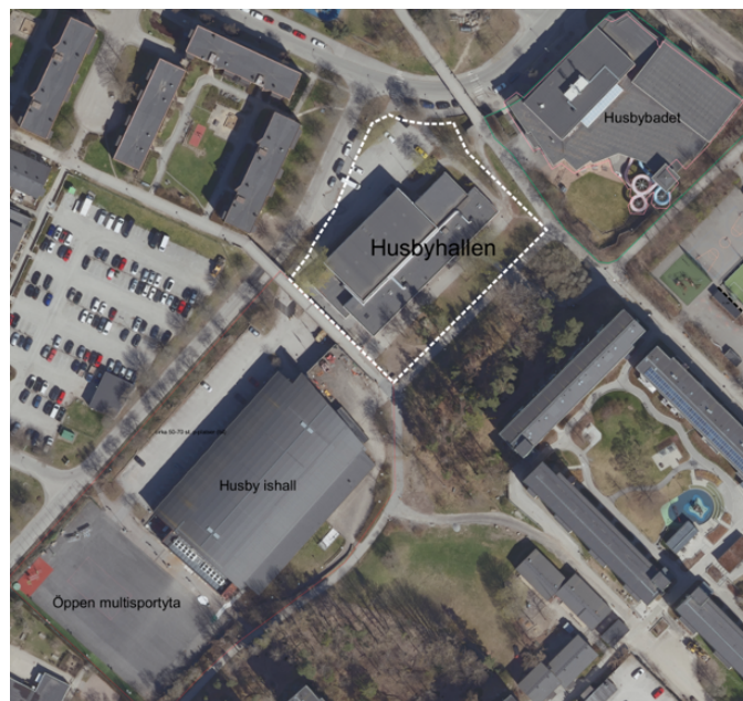
Idrottskluster Husby, Ortofoto dpMap.

Fastighetskontoret Fastighetsavdelningen