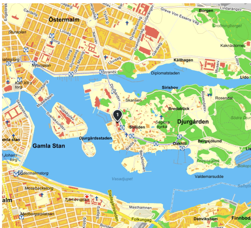
Karta med placering av Liljevalchs konsthall, markerad vid nr 1.

Projektet är geografiskt placerat i hörnet Djurgårdsvägen och Alkärret på Djurgården i Stockholm. Liljevalchs konsthall ligger på Djurgårdsvägen 60 och postadressen är 115 21 Stockholm. Fastighetens namn är Konsthallen 1.