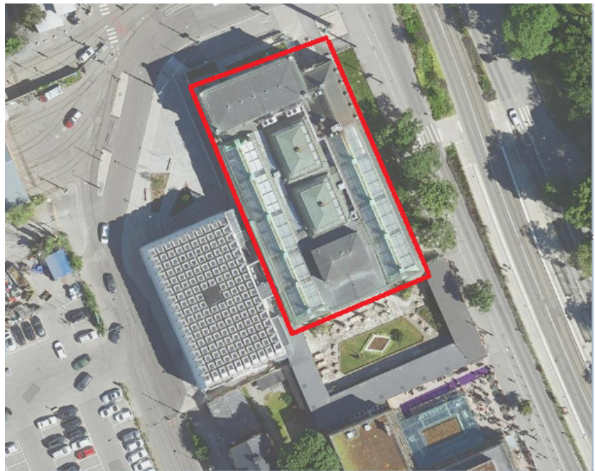
Bild 1. Bergstenshuset som är en del av Konsthallen 1 är markerat inom röd fyrkant på bilden.