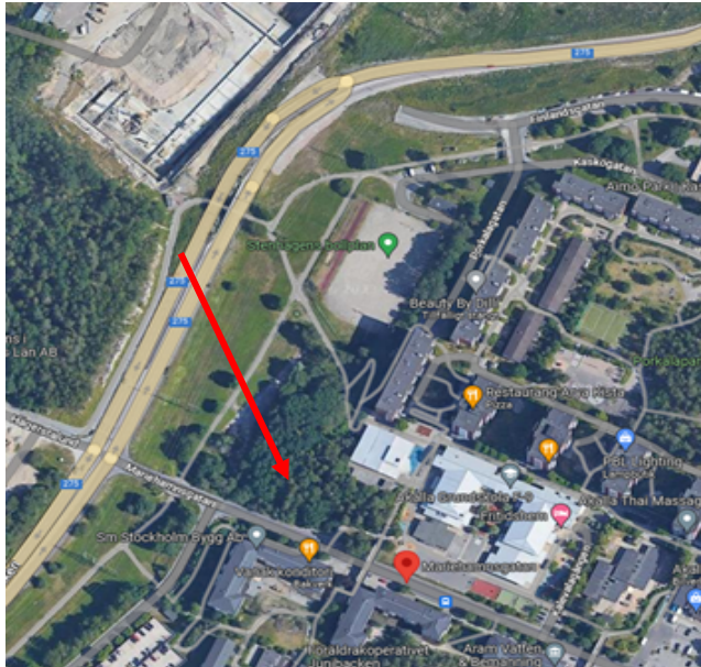
Figur 1: Mariehamngatan, pilen visar tänkt placering av idrottshallen (ortofoto, google map).