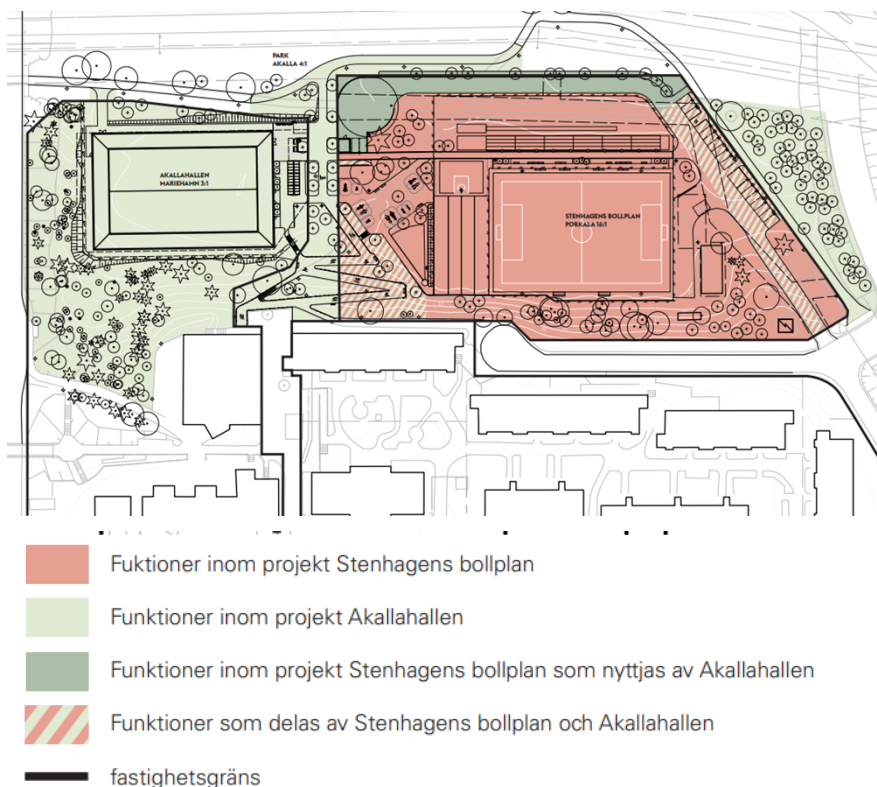
Figur 4: Situationsplan som illustrerar hur de två projekten Akallahallen och Stenhagens BP är beroende av varandra. Åtgärder inom de ljusgröna områdena ingår i Akallahallens budget.