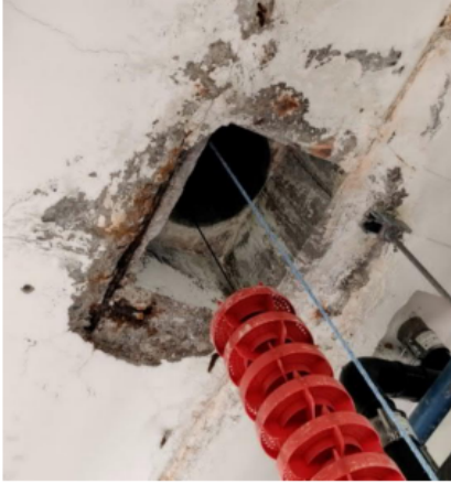
Figur 3, spjälkad och blottad armering vid genomföring för lindrag. Källa: Skadeutredning tävlingsbassängen (25m) WSP 2024-09-06