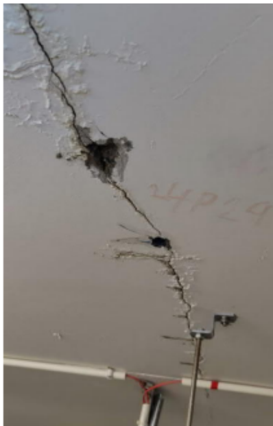
Provtagning 24P29. Provtagning mitt i krympspricka för ramp. Källa: Skadeutredning garage WSP 2024-09-10