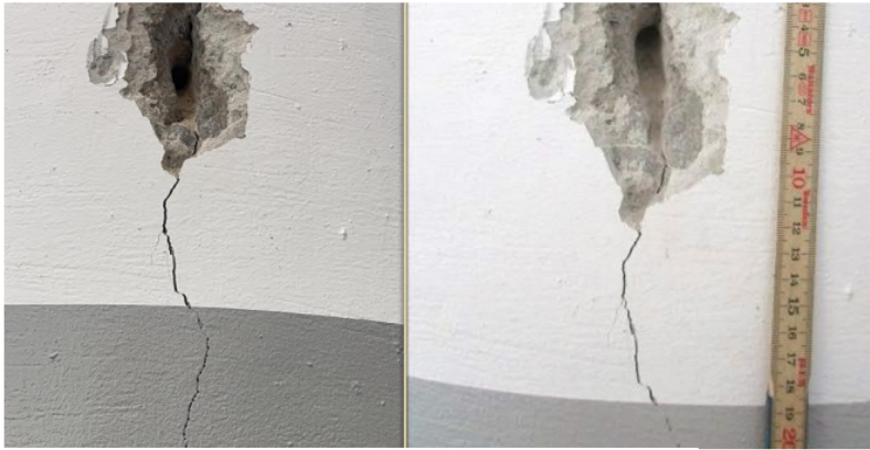
Figur 5, bild till vänster är från 2024 och bild till höger från 2016.

Stompelare för taket har vertikala sprickor längs med pelarnas längd: