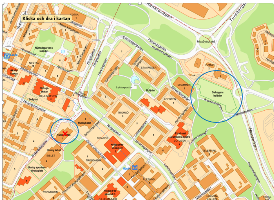
I denna kartbild är Husbyhallen samt Dalhagens BP inringade (dpMap).

Parkering anläggs för cirka 20 bilar och cirka 40 cyklar. Det ska finnas 1–2 RHP:er (särskild plats för rörelsehindrade) samt en p-plats för stadens driftspersonal.