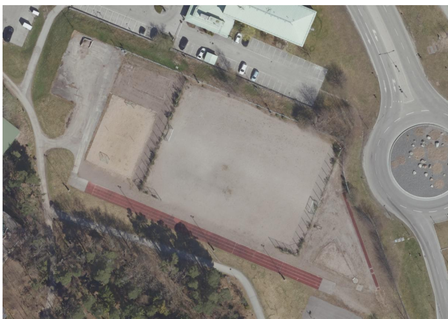
Situationsplan över den befintliga anläggningen – Dalhagens BP.

Fastighetskontoret Fastighetsavdelningen