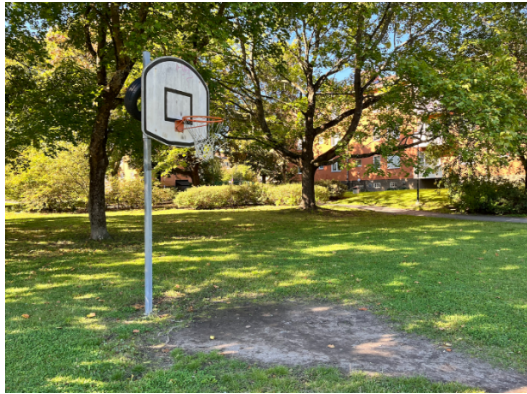
Befintlig basketkorg som är i behov av upprustning i Viktoriaparken i Långbro.