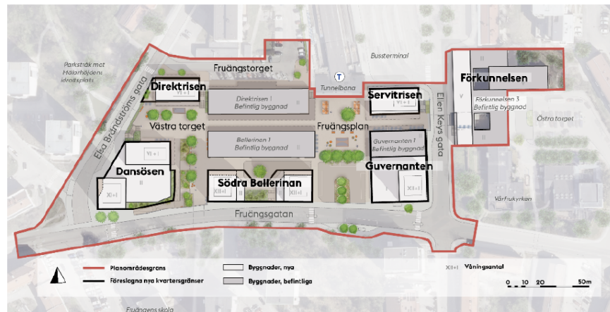
Situationsplanen redovisar föreslagen ny bebyggelse i vitt och planområdesgräns med röd linje. Bild Landskapslaget och stadsbyggnadskontoret.

Planförslaget föreslår rivning av tre byggnader i centrum som ersätts med nybyggnation. Vidare föreslås delvis rivning av och tillbyggnad på en byggnad, samt påbyggnad på en annan byggnad. Material från rivna byggnader ska i så stor utsträckning som möjligt återbrukas.