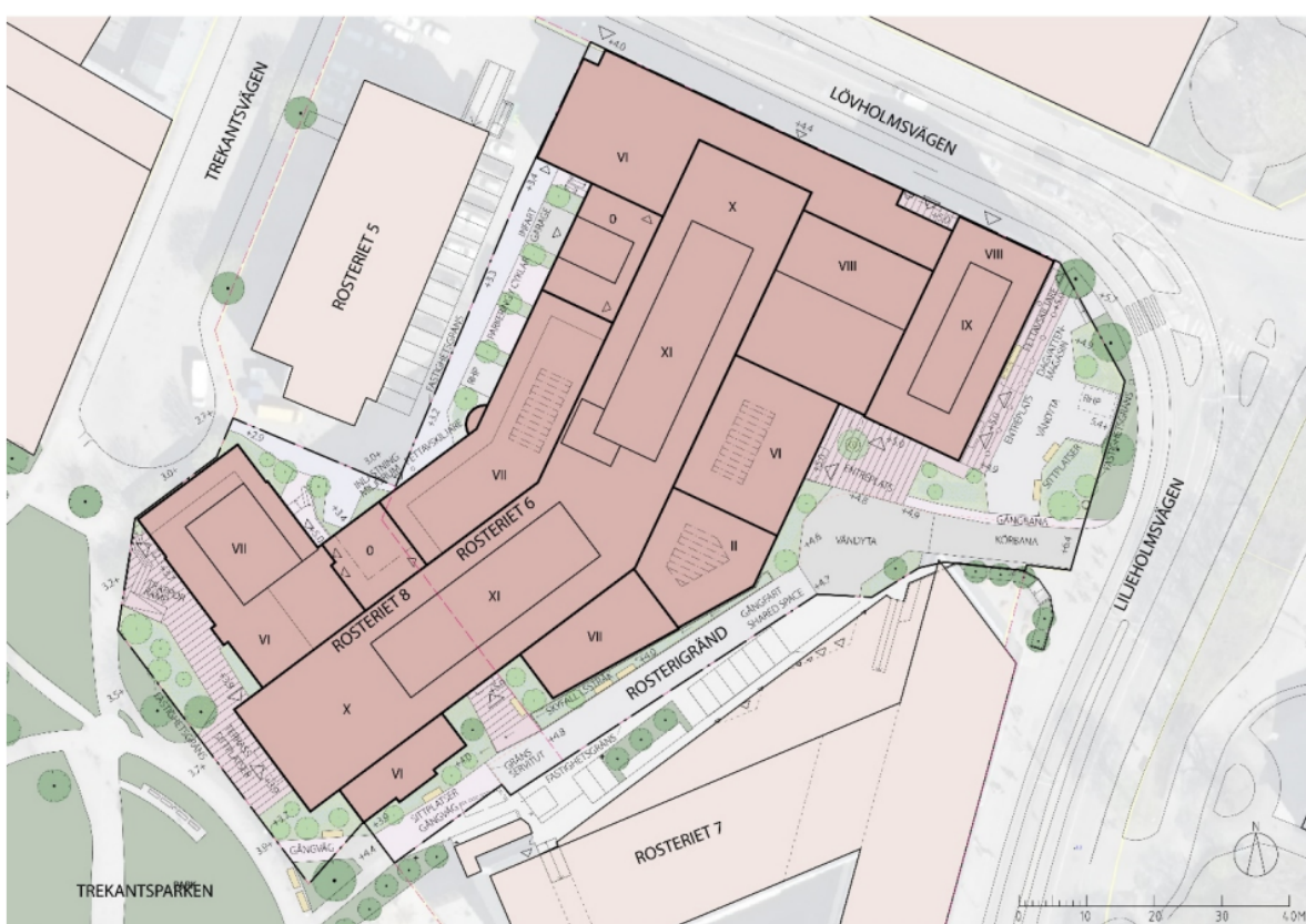
Illustrationsplan för planområdet. (Illustration SWMS arkitektur)

Delar av taken föreslås utformas som gröna, vilket både bidrar till biologisk mångfald, dagvattenhantering samt verkar temperaturutjämnande.