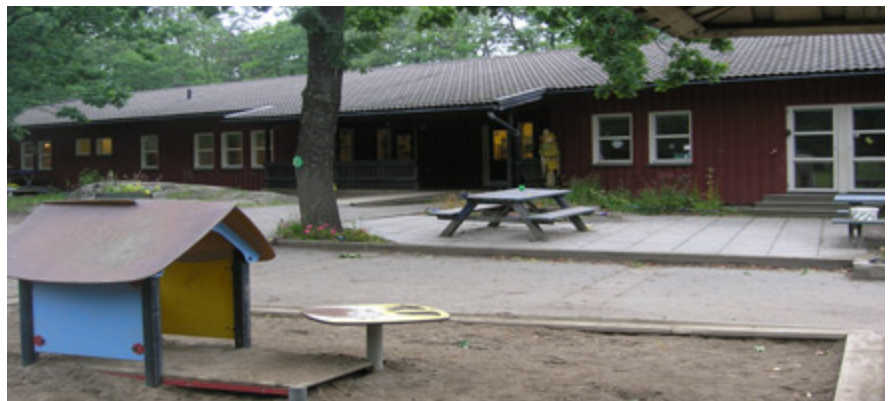
Befintlig förskola på Teatersällskapet 3 från 1975.

Förskolan Solbacken ligger på fastigheten Teatersällskapet 3 på Personnevägen 78 i Hägersten. Byggnaderna ägs av Skolfastigheter i Stockholm AB (SISAB), som har tomträtt på fastigheten. Förskolan har åtta barngrupper i tre enplansbyggnader. Två av byggnaderna är ifrån 1975 och den tredje utgörs av en paviljong med permanent bygglov från 2006.