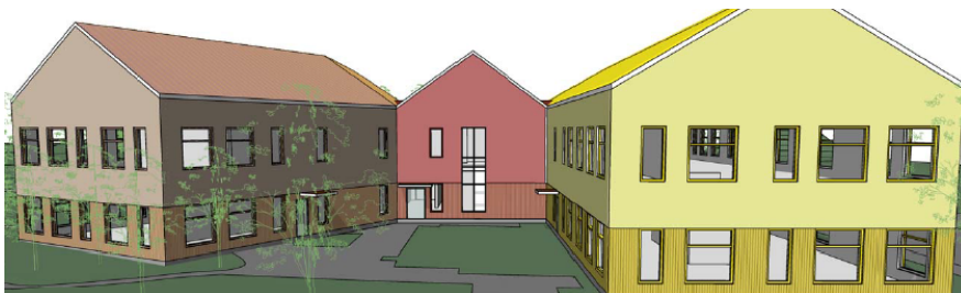
Förskolans utformning, vy från söder med mindre innergård. Cedervall arkitekter.