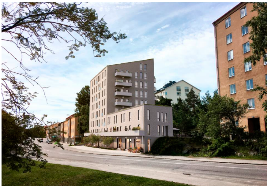
Illustration utmed Sparbanksvägen som visar den nya bebyggelsen. (Kod Arkitekter)

Detaljplanens genomförande innebär att parkmark går över till att bli kvartersmark med bostadsändamål. Den befintliga gångvägen mellan Vinstvägen och Sparbanksvägen får en något ändrad dragning söder om den nya byggnaden. På grund av höjdskillnaden på platsen är gångvägen inte fullt tillgänglig, varken i dagsläget i planförslaget.