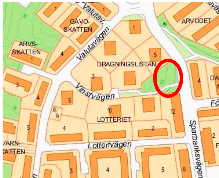
Planområdets placering vid Sparbanksvägen på Hägerstensåsen.

Detaljplanen syftar till att möjliggöra ett flerbostadshus med 45 bostäder, samtliga hyresrätter, på Hägerstensåsen.