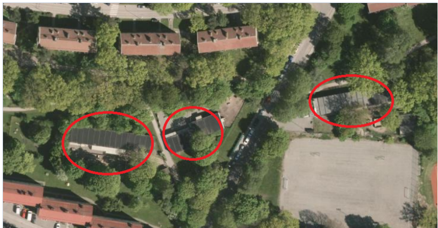
På ovanstående flygfoto är förskolepaviljongerna inringade med rött.

Stadsdelsförvaltningen har haft sammanlagt tre förskolepaviljonger med tidsbegränsade bygglov vid Stenkilsgatan. Två av dem har avetablerats medan en paviljong, norr om idrottsplanen, finns kvar. Under perioden 2017 till och med 2022 kommer det att byggas 780 lägenheter i Aspudden och antalet barn i förskoleålder väntas öka ifrån dagens 650 till 740 barn år 2022. Det föranleder ett behov av att bygga en ny permanent förskola i området.