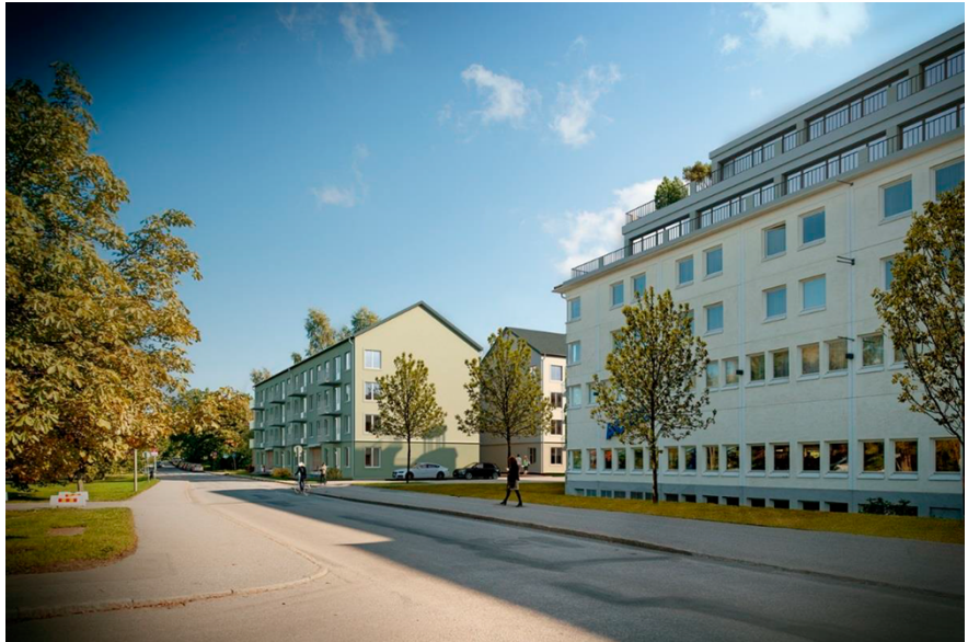
Vy från Västertorpsvägen, hotellbyggnad med påbyggnad till höger i bild.