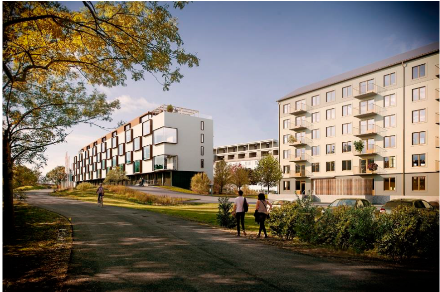
Stockholmshuset och studentbostäder sett från gång- och cykelvägen.

gräsytor och lekytor, delar av gemensamhetsytorna bör förses med tak för att minska buller.