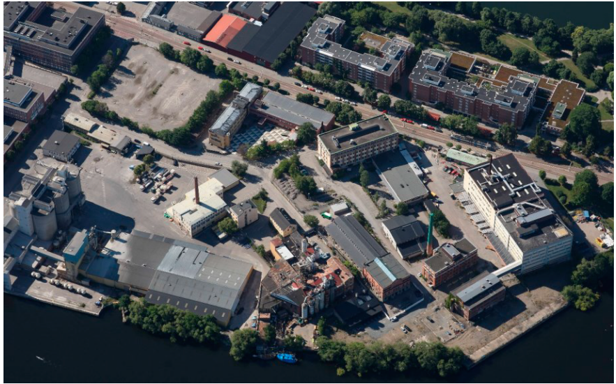
Flygfoto av Lövholmen från norr.