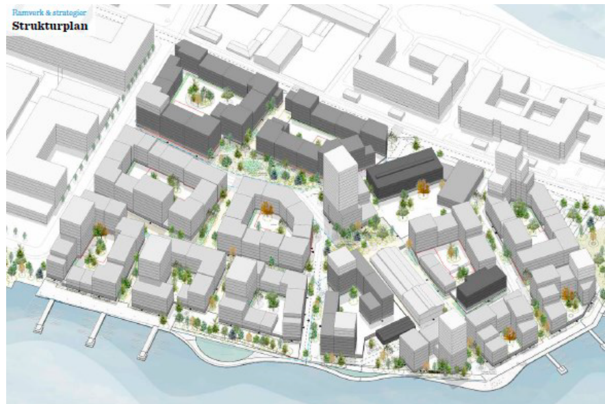
Föreslagna volymer enligt strukturplanen över Lovholmen. Bild: Gehl Architects.

Sex koncept har tagits fram för att nå den mänskliga skalan.