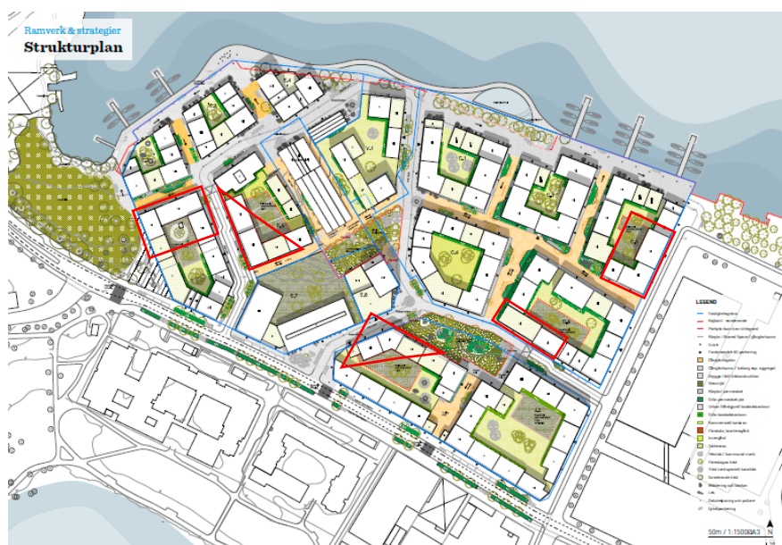
Strukturplan över Lövholmen. Potentiell placering av förskolor markerat i rött. Illustration: Gehl Architects

I strukturplanen föreslås att totalt 33 förskoleavdelningar byggs inom projektet för att tillgodose det ökade behovet av förskoleplatser i stadsdelen. Förskolorna placeras i bostadshusens bottenvåningar och avdelningarna föreslås fördelas på tre förskolor med sju avdelningar och två förskolor med sex avdelningar. Förskolegårdarna föreslås inrymmas på bostadsgårdarna och motsvara fem kvadratmeter gårdsyta per barn, men kompletteras med lika mycket vistelseyta förlagd i de två nya parkerna.