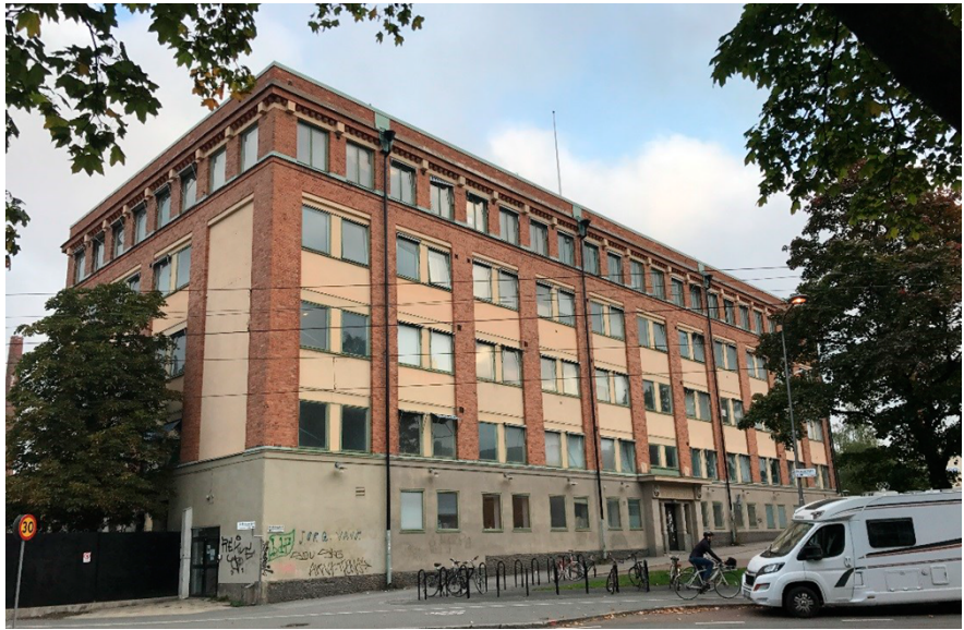
Beckershuset vid Lövholmsvägen som föreslås bli skola.

Strukturplanen föreslår även en ny grundskola med årskurserna 7-9 för cirka 600 barn i den befintliga byggnaden Beckershuset vid Lövholmsvägen. Byggnaden behöver kompletteras med länkbyggnad, idrottshall, skolmatsal och skolgård. Skolgården ska kompletteras med vistelseyta i de två nya parkerna.