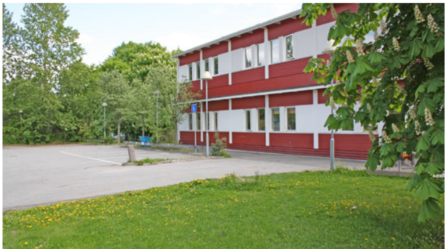
Förskolepaviljong med tidsbegränsat bygglov

I anslutning till fastigheten hyr stadsdelsförvaltningen 1 900 kvadratmeter parkmark som nyttjas till förskolegård. Båda byggnaderna fungerar än så länge väl, men den äldre byggnaden kommer om några år att behöva byggas om och den tillfälliga paviljongen får inte stå kvar längre än till 2022.