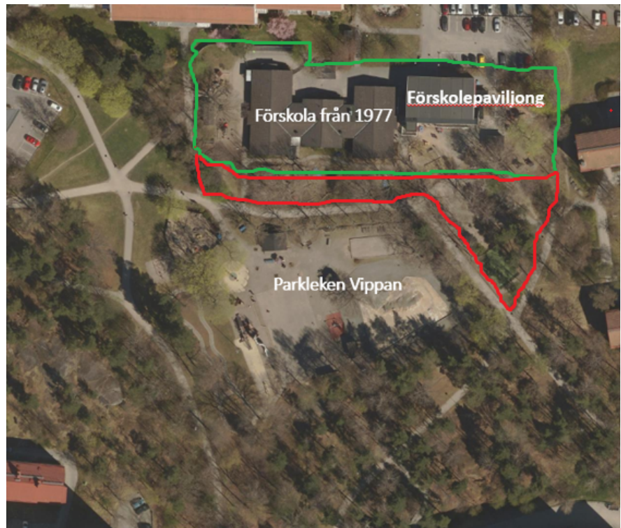
Fastigheten Kraghandsken 5 är inringad med grönt och parkmarken som förskolan hyr är inringad med rött på ovanstående flygfoto.