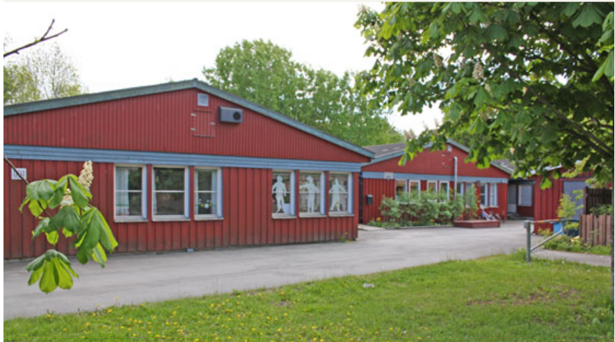
Befintlig förskola från 1977

Förskolan Ellen Fries på Ellen Fries Gata 10 i Fruängen består dels av en fristående förskolebyggnad från 1977 och dels av en paviljong med tidsbegränsat bygglov som uppfördes 2007.