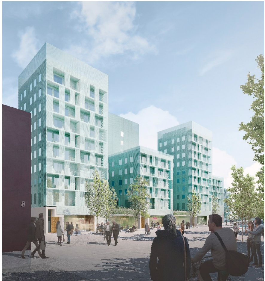
Bladverket, del av Fonden till vänster i bild. Illustration: Joliark AB