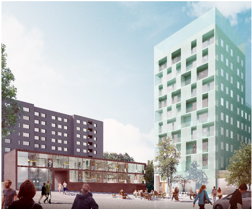
Fonden, del av Bladverket till höger i bild. Illustration: Joliark