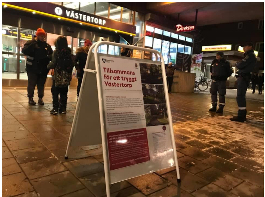
Dialogmöte med syfte att återkoppla närmiljövandringen som resulterade i trygghetsinvesteringen.