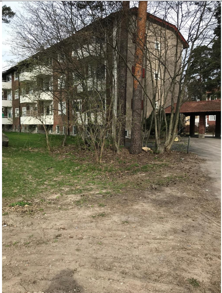
Träd och växtlighet som skymmer sikten.