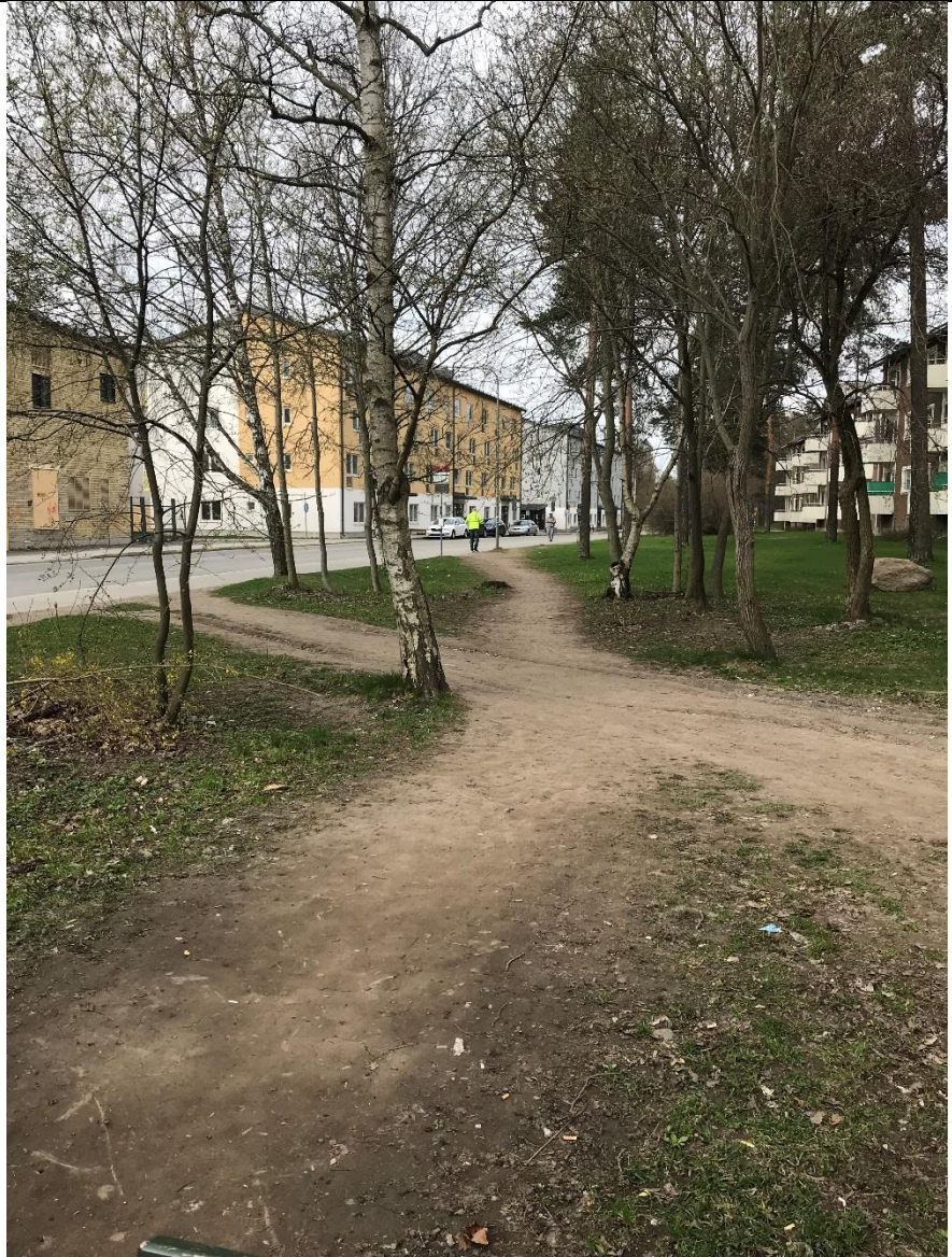
Smitväg från Västertorpsvägen till tunnelbanestationens entré.