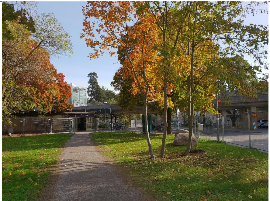
Ny gångväg sett från Västertorpsvägen.