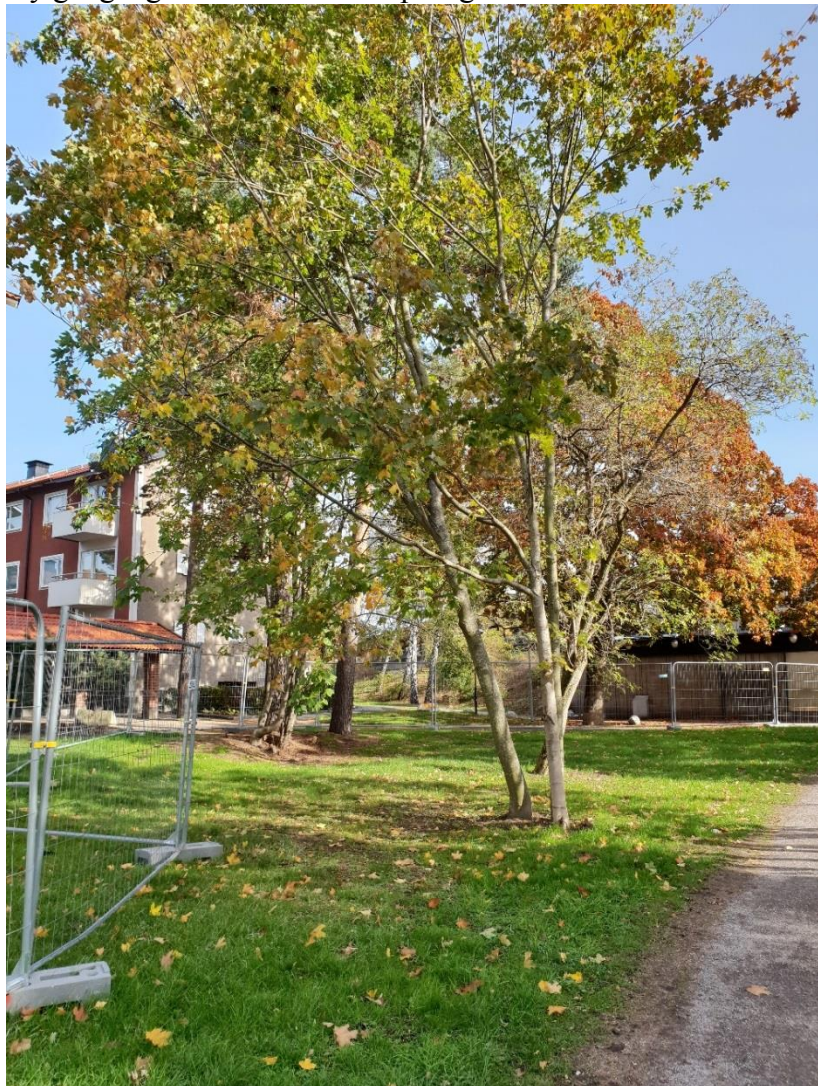
Bättre sikt från ny gångväg.