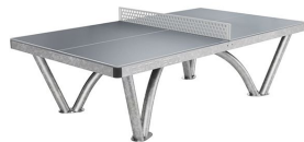
2st Utomhusbord för pingis