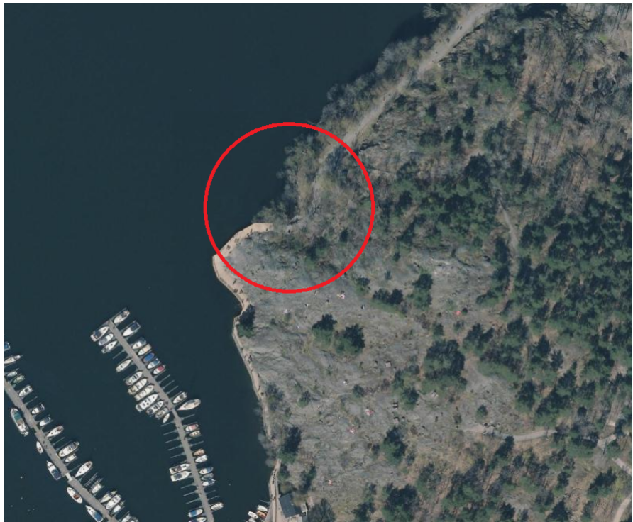
Bild 2 tänkt placering av bastuflotten, precis norr om Örnbergs småbåtshamn