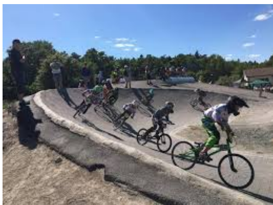
BMX-bana i Högdalen