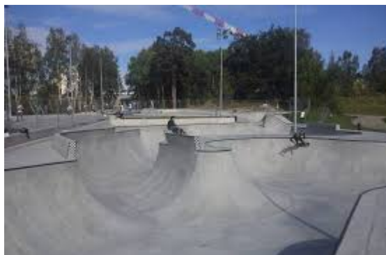
Planerad skatepark i Aspudden