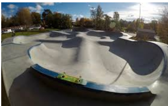
Skatepark i Gubbängen

En upprustning av befintlig gångväg längs diket i Riddersviks gårdsvägs förlängning, gör det lättare att ta sig till anläggningen och även till Lövsta och Kyrkhamnsområdet. Gångvägen kan enkelt breddas så att även cyklar och barnvagnar kan ta sig fram. Ungarna som flyttar in i nya Riddersvik kommer att få riktigt nära till vettig fritidssyssla, något som lämpligen tas med i planering och utformning av bebyggelsen på gamla trädskolan och runt Kraftvärmeverket.