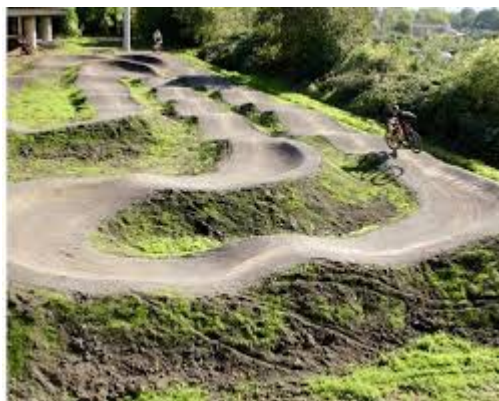
Planerad BMX-bana i Ugglebo

Den anläggning vi hade i Gulsippan kritiserades av åkarna för att vara tråkig och enahanda, som ett tivoli med bara en åkattraktion. Den var dessutom felbyggd i material som gav resonans, dvs oljud när hårda hjul åker på hårt underlag. Det går att bygga tysta, omväxlande och roliga banor med rätt kunskap och teknik.