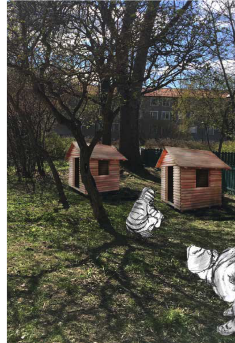
Genom att använda den vegetation som finns kan man skapa spännade rum.