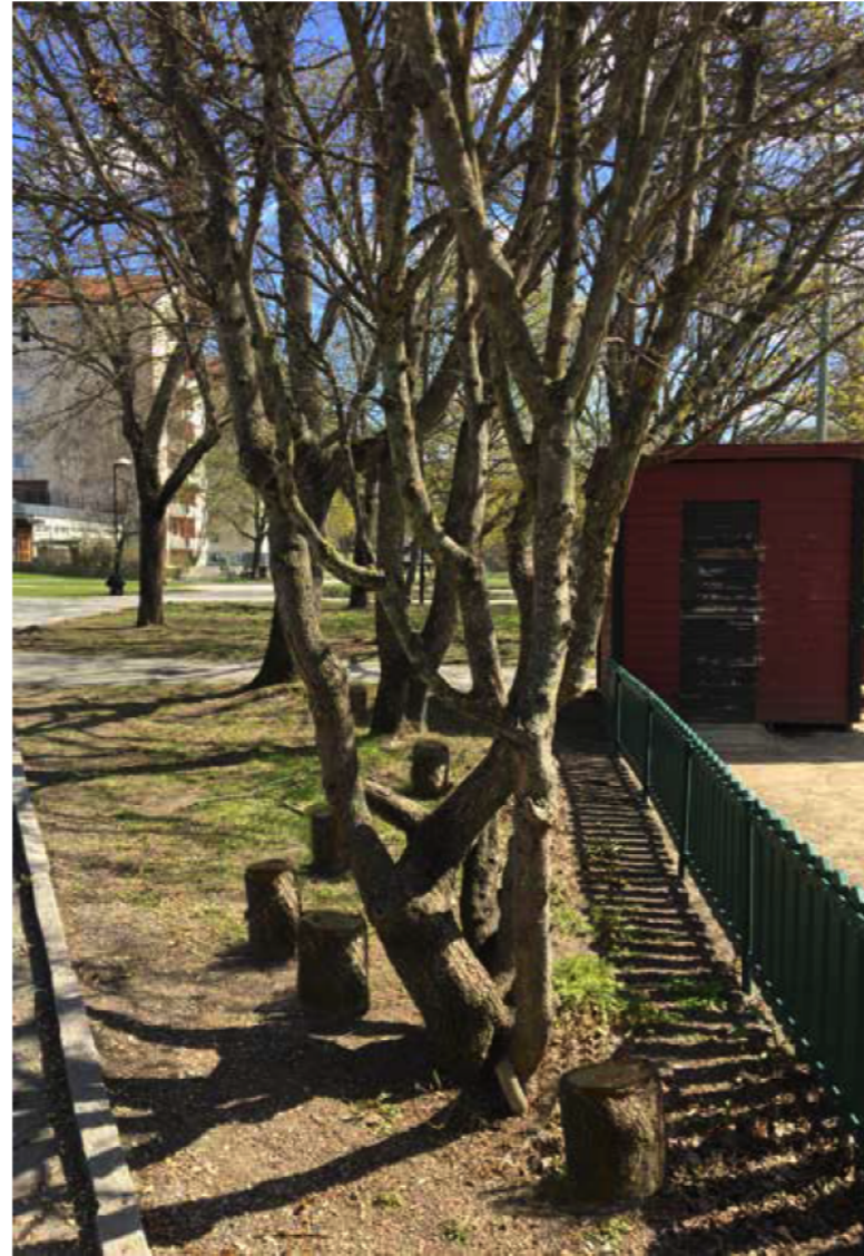
Genom att exempelvis använda den natur som finns och skapa nya tillägg kan man skapa spännande miljöer som lockar.