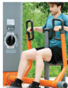
HORISONTELL RODD, U10