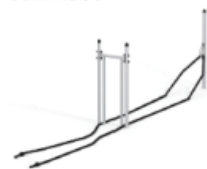
TRAINING MED REP, U9