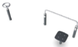
UP & GO, U8