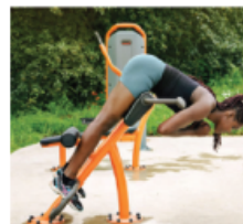
BÄNK FÖR LÄNDRYGG, U7