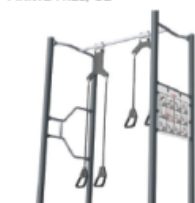
SUSPENSION TRAINER COMPACT, U4