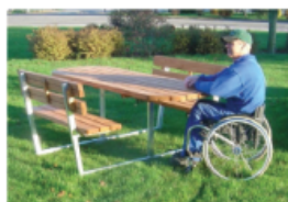
TILLGÄNGLIGHETSANPASSAT BÄNKBORD, LINA, TRESS, U18