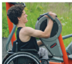
ARM CYKEL, U2