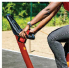
MOTIONS CYKEL, U1