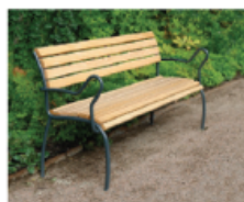
BÄNK ACCESS, NOLA, U17