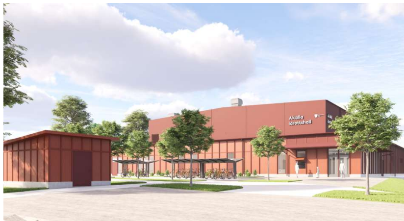
Vy av entré, Akallahallen.

Projektet är nära sammankopplat med upprustningen av Stenhagens BP; båda projekten genomförs som en entreprenad. Tillsammans bildar de en anläggning för idrottande både inomhus och utomhus.