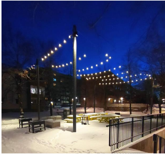
Bild på masterna med strålkastare och ljusslingorna över borden