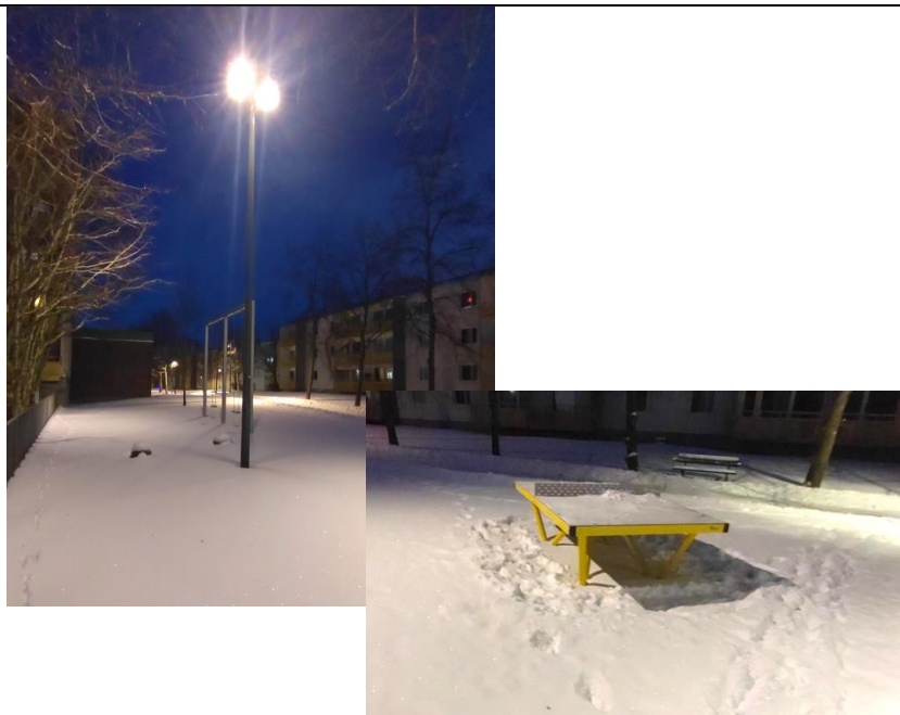
Mast med strålkastare vid lekutrustningen