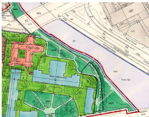
Serafimerstranden. Dp 6958. (1981)

Kontoret kan konstatera att de nu föreslagna platserna alla är detaljplanelagda som park- eller naturmark. Där broarna är finns dock också planstöd för att bro får uppföras.