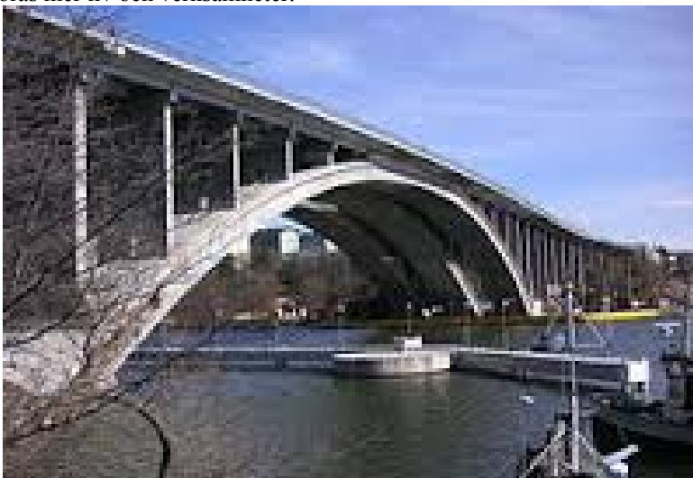
Foto: Tranebergsbron är ett exempel på en lång bro, med ödsliga ytor inunder, som skulle tjäna på att göras mer levande.

Förvaltningen ställer sig positiv motionen som vi finner till-talande. Ska staden upplevas som trevlig för dess invånare är det angeläget att uterummet står i samklang med stadens gestaltning och identitet och görs mer levande och intressant. Utrymmena under broarna är många gånger ödsliga platser som skulle tjäna på att tillföras mer liv och verksamheter.