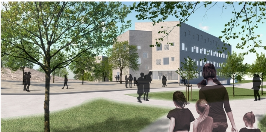
Illustration mot nya hus H

Situationsplan över befintliga och planerade byggnader. Hus A behålls. Hus B, C och D rivs för att möjliggöra nybyggnad. Hus H är nybyggnad som förutom hemvist ska inrymma kök, matsal och administration. Hus J är nybyggnad för idrott, trä/metall- och textilslöjd samt musik och bild.