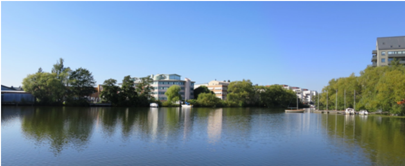
Vy från vattnet. Masugnen 7 till vänster och Masugnen 5 till höger.

något betydande arkitektoniskt värde. Byggnaderna har ingen relation till Karlsbodavägen eller Bällstaviken. Mellan volymerna finns öppna ytor med parkeringsplatser och enstaka planterade träd. Kontorsbyggnaderna inom planområdet kommer att rivas vid ett plangenomförande. Strandområdet är idag svåråtkomligt och Bällstaviken är svår att upptäcka från Karlsbodavägen på grund av kontorsbyggnadernas placering och orientering. De stora hårdgjorda ytorna mellan byggnaderna inbjuder inte till rörelse ner mot vattnet. Grönskan längs med strandkanten ger vattenrummet en grön karaktär. Byggnadernas höjd sammanfaller med vegetationens.