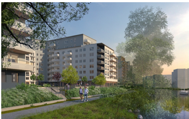
Illustrationen visar möjlig utformning av Masugnen 7:s möte med strandparken och vattnet

av gårdsrummet. Gavlarna, förskolans volym och gården med terrasseringar bildar en mjuk men tydlig gräns mot strandparken. Bebyggelsens höjd behålls mot entréparken för att sedan trappas ned mot strandparken. Fasadens höjd ger en relation till volymerna i Masugnen 5 och nedtrappningen ger en lägre skala mot strandparken och en övergång till förskolans lägre volym.