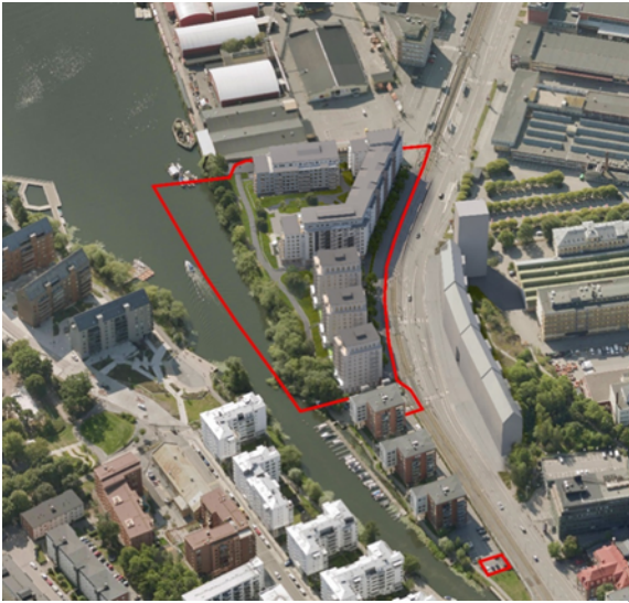
Flygvy över området med den föreslagna bebyggelsen Röd linje illustrerar planområdet

Möjlighet till cykelparkering kommer att finnas både i separata cykelrum inom de respektive fastigheterna och utomhus på anordnade platser. Beräknat parkeringstal för cykel blir 3/100 kvm ljus BTA. Bilparkering kommer huvudsakligen att ske i parkeringsgarage under husen. Masugnen 7 har ett beräknat parkeringstal på 0,4. Masugnen 5 får med mobilitetsåtgärder ett beräknat parkeringstal på 0,32 bilplatser/lägenhet. Med tanke på den goda kollektivtrafikförsörjningen till området, bedöms detta vara tillräckligt. Tidsbegränsad besöksparkering sker på lokalgatorna i området. Slutligt parkeringstal för cykel och bil fastställs i bygglovskedet.