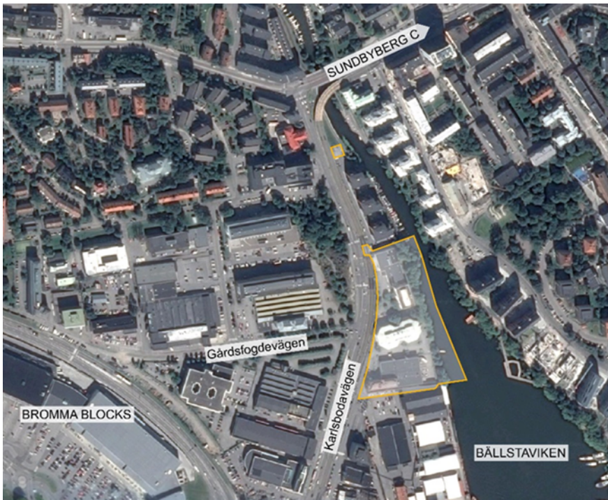
Flygfoto med planområdet och dess omgivning.