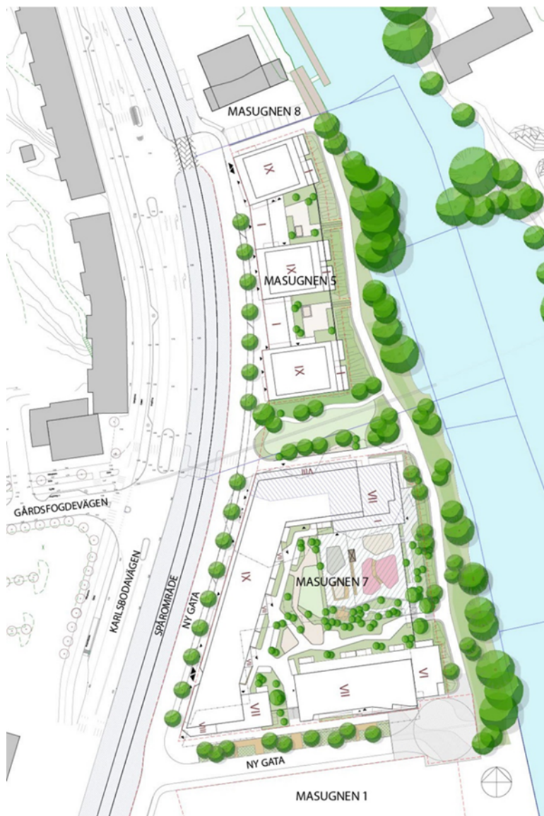
Situationsplan för Masugnen 5 och 7 med föreslagen bebyggelse.