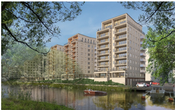
Illustrationen visar den föreslagna bebyggelsen på Masugnen 5 mot strandparken och Bällstaviken.

Byggnaderna består av 8 våningar och en indragen våning. Denna höjdskala tar sin utgångspunkt i befintliga byggnader i Masugnen 8 och på andra sidan Bällstaviken samt den planerade bebyggelsen söderut och i Archimedes 1 m fl. Varje huskropp har en utskjutande volym mot gatan som tar upp rytmen som finns i Masugnen 8. De utskjutande delarna regleras med en planbestämmelse. Mot strandparken ramas balkongerna in med öppna väggar så att byggnadskroppen upplevs som två smalare volymer. En planbestämmelse reglerar fasadens vertikalitet mot stranden.