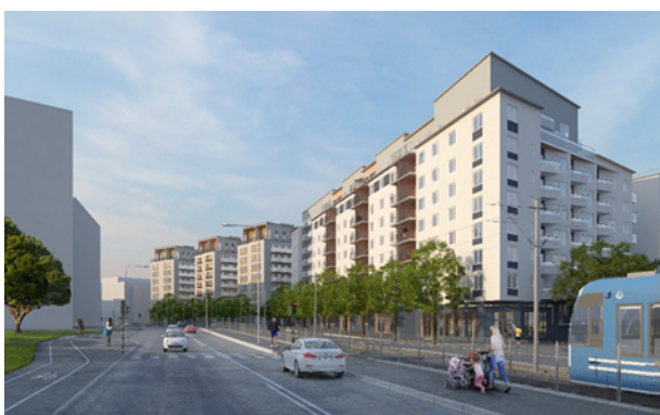
Illustrationen visar föreslagen bebyggelses fasader mot Karlsbodavägen

Fasaderna mot entréparken i norr och mot lokalgatan i söder gestaltas med burspråk, vilka regleras av en planbestämmelse. I början av lokalgatan har kvarteret en öppning i volymerna och en entré till gården. Öppningen ger bättre ljusförhållanden samt en möjlighet till passage och siktlinje mot den planerade kvarterstrukturen i Masugnen 1.