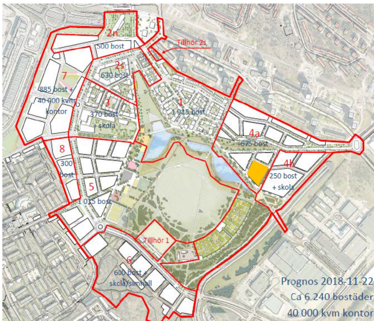
Utbyggnadsetapper Årstafältet, Stockholmshems markanvisning markerad med orange.

Enligt Stockholmshems arbetsordning ska inriktningsbeslut om investeringar överstigande 300 Mkr också godkännas av Stockholms kommunfullmäktige. Investeringsbeslut överstigande 50 Mkr ska anmälas till styrelsen för Stockholms Stadshus AB i samband med nästkommande tertialrapport.