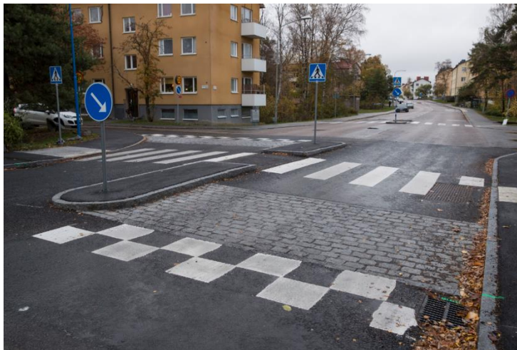
Bild 3: Upphöjt övergångsställe med refug och påfartsramp samt lång nerfartsramp