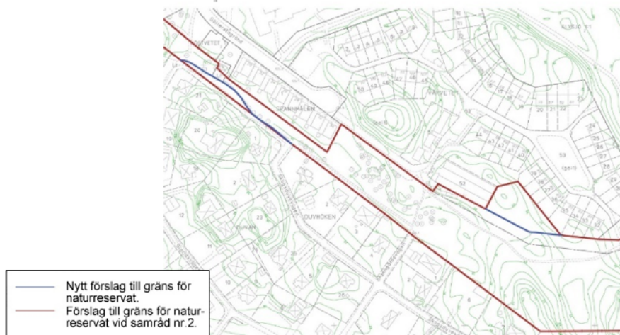
Bild: Kartutsnitt med förslag till ändring av gränsen vid Segerminnevägen/Skogsduvevägen samt kv. Vårvetet 53 jämfört med samrådsförslaget. ¶

En ekonomisk kalkyl med uppskattning av investerings- och driftskostnader för det föreslagna naturreseptatet har tagits fram.