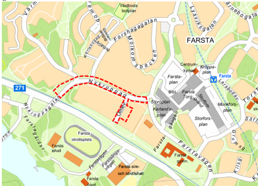
Bild 1 Kartbild med projektets läge markerat med röd streckad linje.

Översiktsplanen lyfter Farsta som ett av stadens fyra fokusområden med omkring 8 000 nya bostäder fram till år 2030. I stadsdelen planeras en större stadsutveckling med bostäder, skolor, parker, torg, service, idrott, kultur och arbetsplatser. Nykroppagatan är utpekad som ett urbant stråk i den viktiga länken mellan Farsta centrum och Magelungens strand.