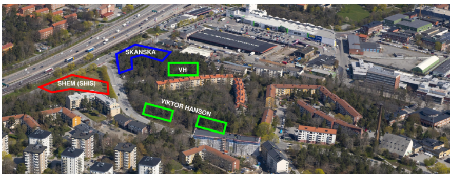
Markanvisad tomträtt till Stockholms hem (SHIS-bostäder). Hela detaljplanen omfattar SHEM, Skanska och byggnadsfirman Viktor Hanson