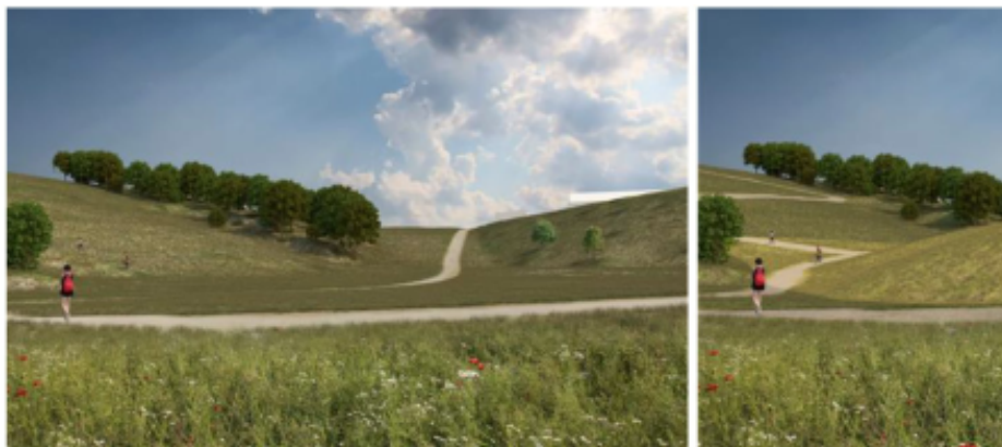
Illustration före och efter anläggande av tryckbank (SBK).

Den förändring av dalgången som sker när tryckbanken anläggs i planområdet sydvästra del, innebär att kontrasten mellan topp och dal försvagas vilket bedöms ha en märkbart negativ påverkan i landskapet. Den negativa förändringen anses motiverad då tryckbanken är nödvändig för att stabilisera slänten.