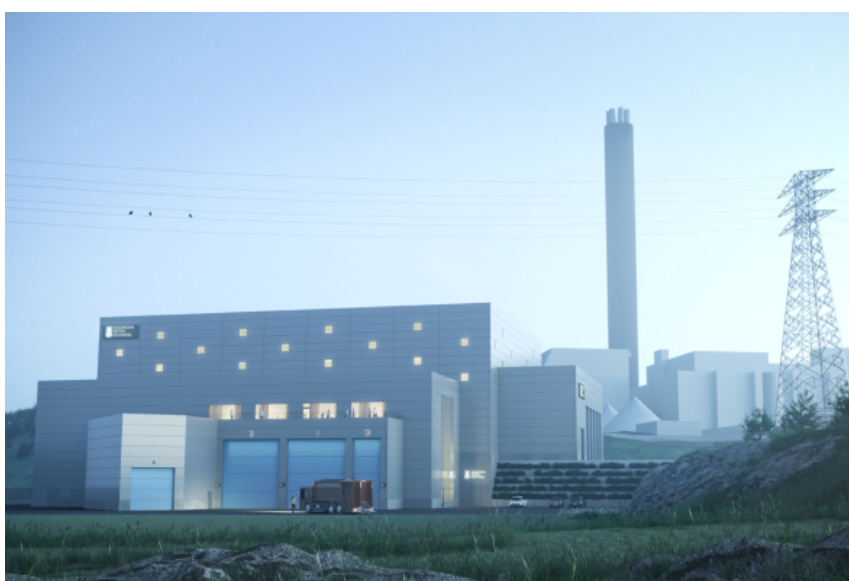
Illustration: vy från nordost som visar möjlig utformning av sorteringsanläggningen (Liljewall arkitekter).

De storskaliga verksamheterna, olycksrisk samt platsens komplexa markförhållanden innebär att flera bestämmelser införs på plankartan som reglerar byggnadsteknik, dagvatten- och skyfallshantering, skydd för olyckor samt hanteringen av risken för ras och skred.