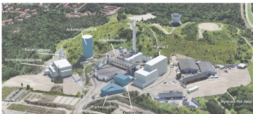
Illustration: vy från nordväst över planområdet med befintliga byggnader samt nya byggnader i blått och vitt samt omgivande mark (Liljewall arkitekter).