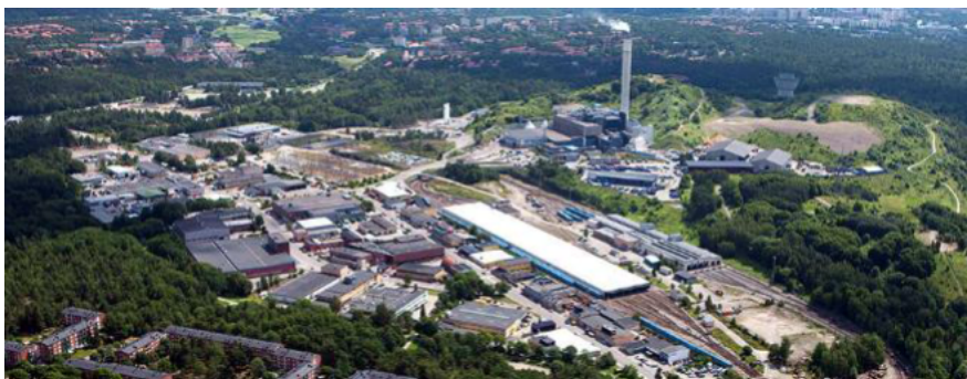
Bilden visar Högdalens industriområde omgivet av Högdalstopparna. Högdalens värmeverk med den höga skorstenen syns till höger i bilden.