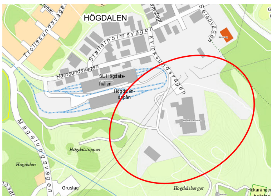
Karta som visar planrådets ungefärliga avgränsning.

Norr om planområdet ligger Ellevios ställverk och i nordväst gränsar planområdet till Högdalens tunnelbanedepå. Närmaste bostadsbebyggelse ligger ca 450 - 500 meter från de planerade anläggningarna.