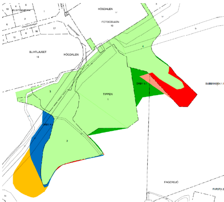
Figur 3. Illustration över ändrad markanvändning från detaljplanens planbeskrivning. Ljusgrön = fortsatt kvartersmark. Mörkgrön = ändras från allmän plats för park till kvartersmark för värmeverk eller avfallssortering. Ljusröd = fortsatt allmän platsmark, men ändrad från park till natur. Mörkröd = ändras från kvartersmark till allmän plats natur. Gul = ändras från icke planlagt till allmän plats för park. Blå = ändras från icke planlagt till kvartersmark för avfallssortering m.m.

Staden ska överlåta mark till Exergi, medan mark till SVOA och Prezero Recycling AB, nedan Prezero, ska upplåtas med tomträtt.