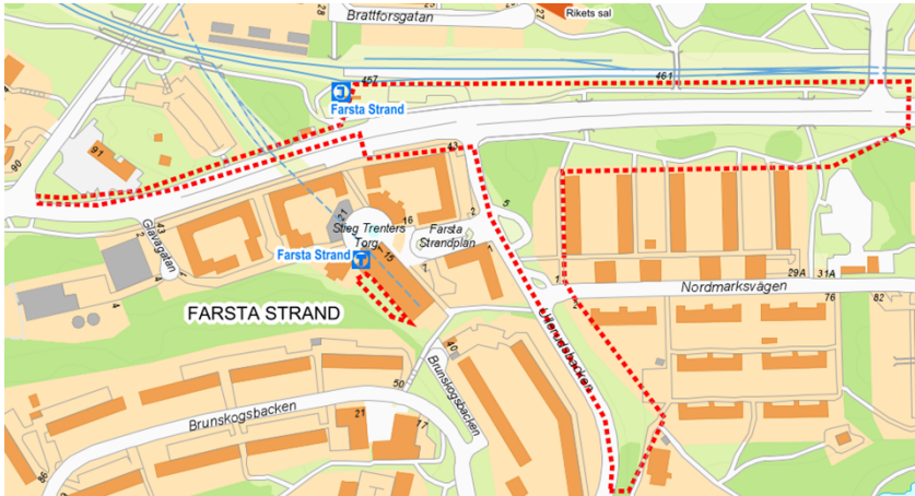
Figur 1. Ungefärligt projektområde inringat med röd streckad linje.

Flera utredningar har genomförts inom ramen för detaljplanearbetet samt även inom stadens systemhandlingsarbete. Inom projektområdet finns vissa utmaningar med höga vattenflöden vid skyfall som krävt noggrann höjdsättning av marken samt tillskapande av ett lågstråk, ett höjdsatt och gestaltat dike, för att kunna hantera större flöden.