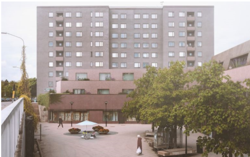
Vy från Selmedalsvägen väster över torget mot föreslagen påbyggnad centrumlokaler i öster. (Bild: Jägnefelt&Milton)

De låga centrumbyggnaderna byggs på i en till två våningar. Centrumbyggnaden i väster byggs på i två terrasserade våningar utförda med platt tak. Fasader utförs i klinker lik den på befintlig byggnad, men i avvikande form och kulör. Centrumhuset på torget byggs på i en våning. Befintligt band av kopparplåt i ovankant fasad på centrumhuset ersätts med klinker lik den på befintlig byggnad, men i avvikande form och kulör. Fasaderna, som på långsidorna lutar svagt inåt, utförs i mörk plåt. Ovan regleras med planbestämmelser.