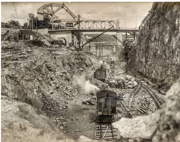
Bild 4. Utbyggnad av Hammarbyleden med Norra Danviksbron i bakgrunden.