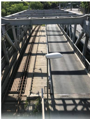
Bild 2. Farbanan på befintlig bro, Saltsjöbanans spår och ett busskörfält.

Norra Danviksbron är en öppningsbar klaffbro över Danvikskanalen samt en tillfartsbro på östra sidan av kanalen. Bron byggdes åren 1917-1922 i samband med att Hammarbyleden kom till, och förbinder stadsdelarna Södermalm och Södra Hammarbyhamnen.