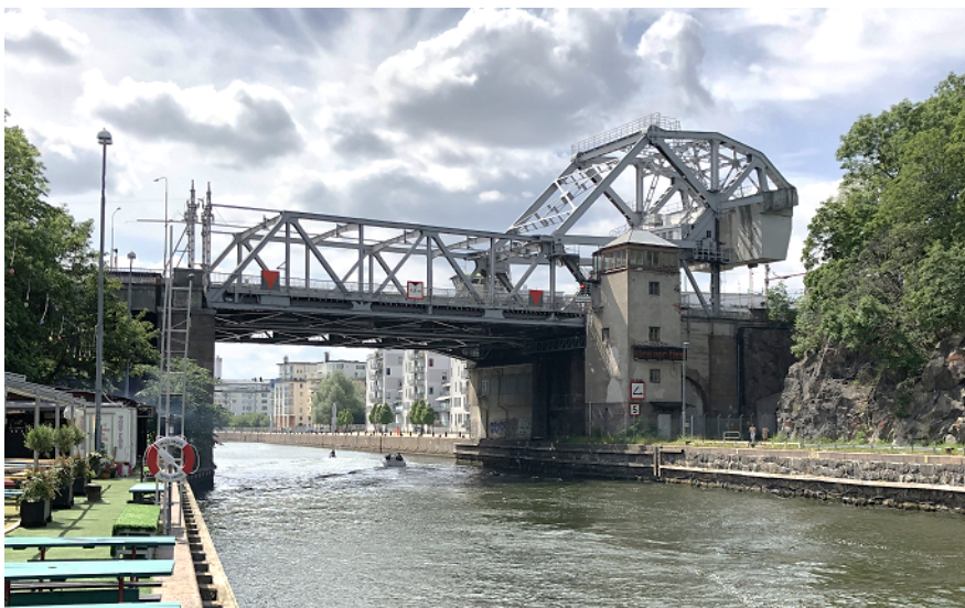
Bild 3. Befintlig bro, sedd norrifrån.