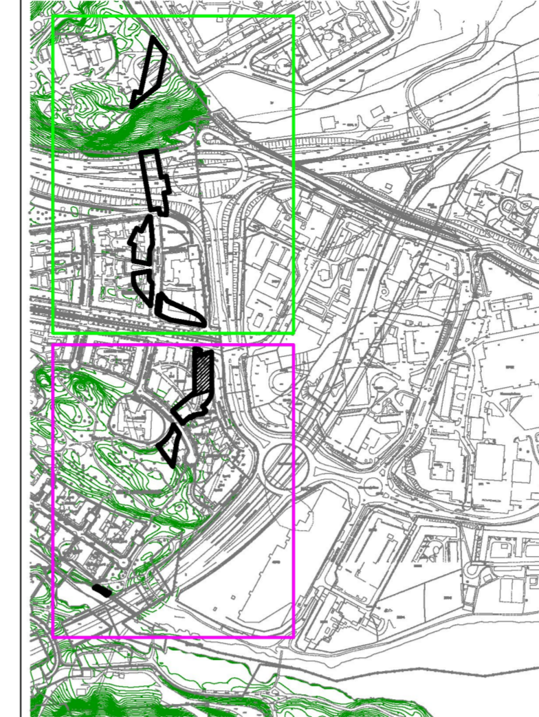
Illustration 1 visar planområdet på baskartan. Del 1 med rosa ram och del 2 med grön ram.