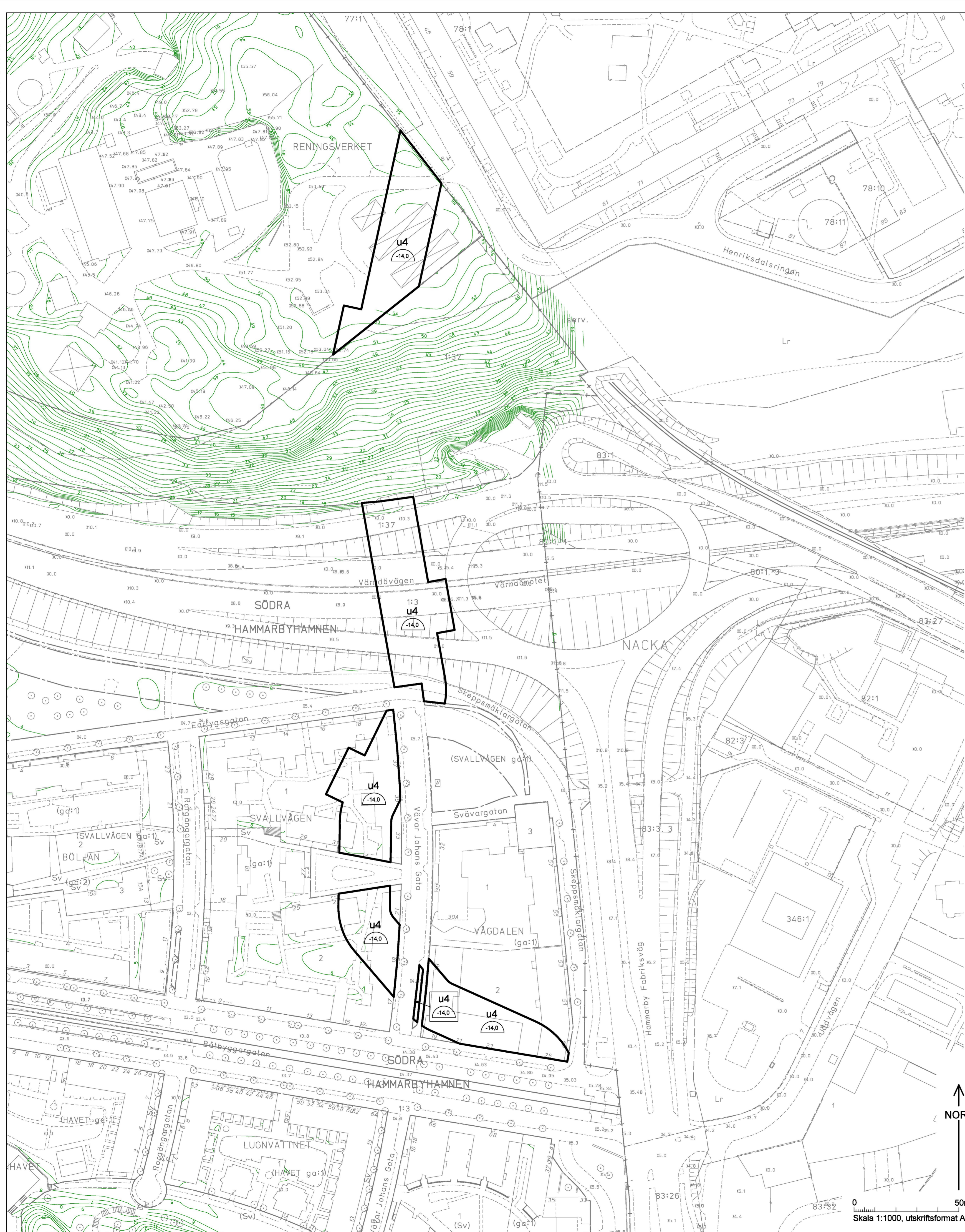
ILLUSTRATION 1 Ej skalenlig