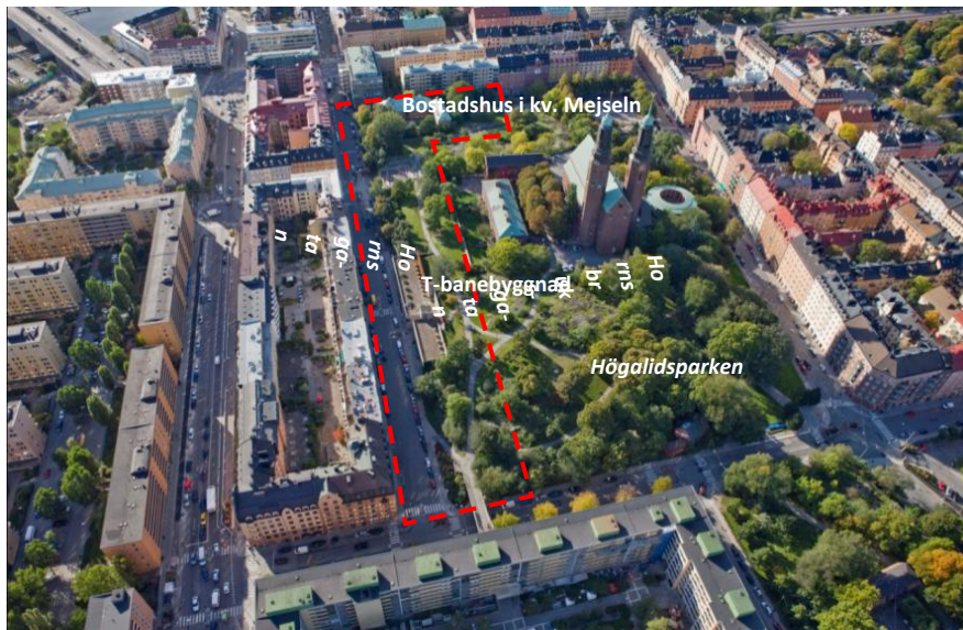
Flygbild över planområdet inom rödstreckad linje sett från öster.

Planområdet omfattar delar av Hornsbruksgratan och södra delen av Högalidsparken i Hornstull på Södermalm. Planområdet är cirka 15 300 kvadratmeter.