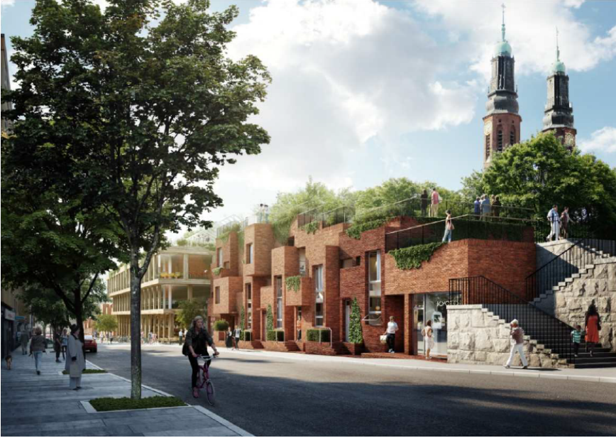
Bostadshuset sedda från öster. I hörnet finns en ny trappa upp till parken. I huset längst österut finns rum för en mindre butik. Illustration: Utopia arkitekter, Lovely landskap och Tham & Videgård arkitek-