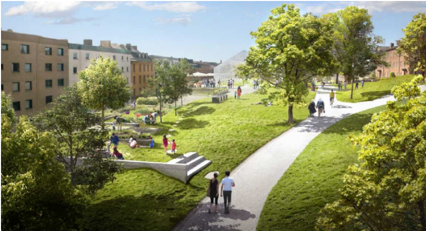
Vy från öster. Högalidsparken förlängs ut över de nya bostadshusen med nya vistelsezoner. Illustration: Lovely landskap