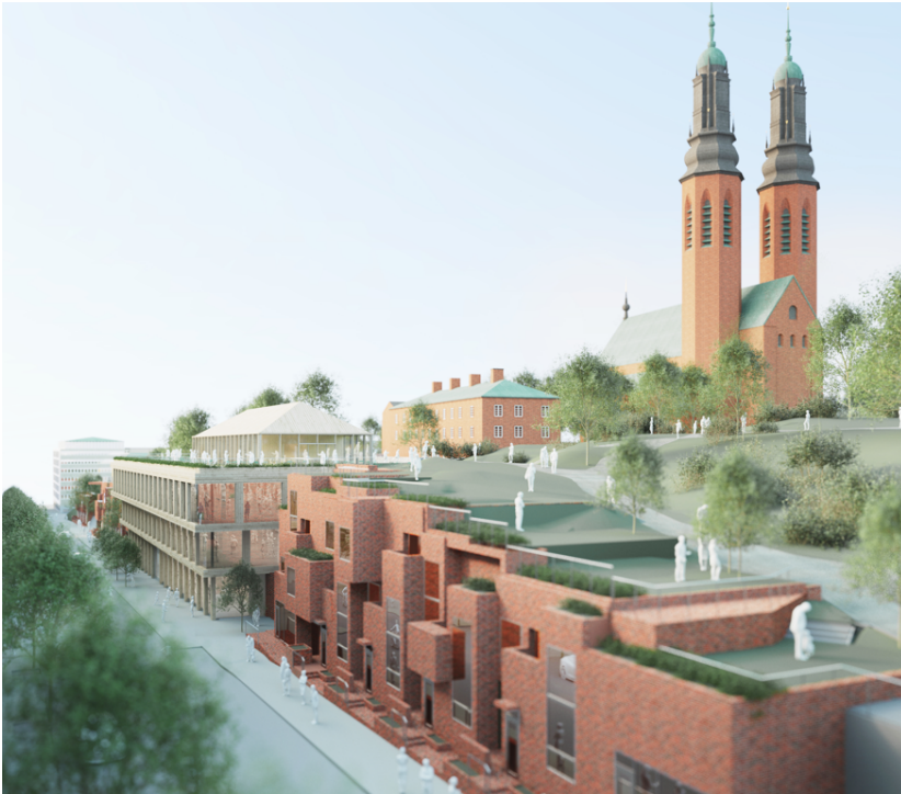
Fågelperspektiv som visar den nya bebyggelsen med Högalidskyrkan i bakgrunden. Illustration: Tham & Videgård arkitekter

Den gamla tunnelbanebyggnaden ska rivas och en ny större byggas i samma läge. SL:s biljetthall och nedgång till tunnelbanan bibehålls. Tunnelbanebyggnaden planeras huvudsakligen för handel som tillåter butiker och restauranger samt centrumändamål i våning två och tre. På taket planeras en mindre byggnad som kan innehålla exempelvis ett kafé eller annan handel. Kontorsanvändning medges inte på takbyggnaden. Huvudbyggnaden kragar i steg ut över gatan. Som fasadmaterial föreslås trä och glas.