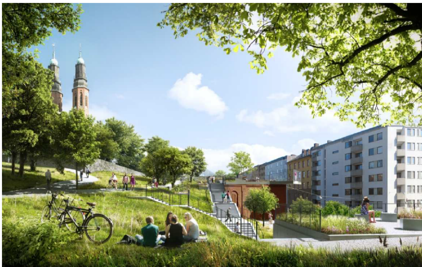
I den västra delen av parken finns ett tema med böljande gräs. Här finns även nya trappor ovanför Stockholm parkerings garage som leder ner till gatan. Illustration: Lovely landskap