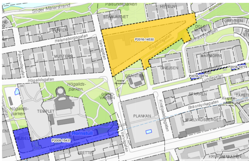
Karta som visar planområdets avgränsning i blått.

Ingen genomförandetid återstår för planerna.