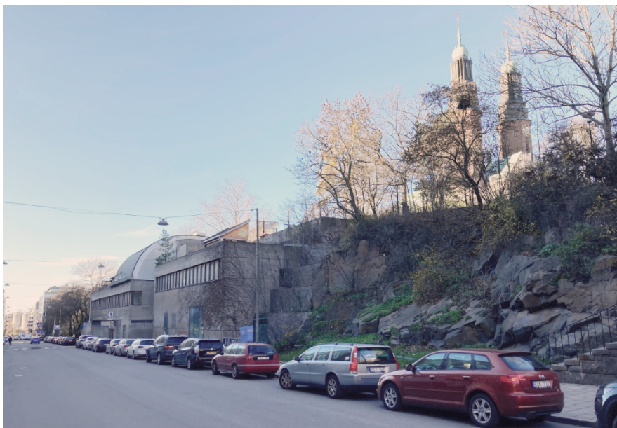
Hornsbruksgatan med bergsskärningen och träden i kanten mot Högalidsparken. Till vänster i bild syns tunnelbanebyggnaden och högst upp till höger syns Högalidskyrkan bakom träden. Bild tagen i november 2021.

Planområdet utgörs av kantzonen till Högalidsparken som präglas av en kraftig bergsskärning upp mot parken. Parken ligger inom stenstadens rutnät och är tydligt rumsligt avgränsad åt alla håll, omgärdad av allmänna gator och bebyggelse i omkring sex våningar. Bergsskärningen och tunnelbanebyggnaden skapar en gatumiljö som har stora slutna partier mot gatan.