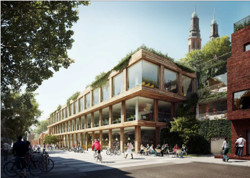
Den nya tunnelbanebyggnaden sedd från öster. Illustration: Tham & Videgård arkitekter