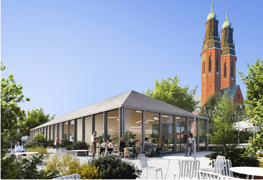
Den mindre uppglasade byggnaden på tunnelbanebyggnadens tak. Illustration: Tham & Videgård arkitekter

De nya bostadshusen uppförs i två till tre våningar med radhus i bottenvåningen och lägenheter ovanför. Det ingår även några lokaler. Fasaderna ska kläs med tegel som refererar till den närbelägna Högalidskyrkan. Lägenheterna är enkelsidiga och hanterar buller genom växlande utskjutningar och indrag i fasad varvid ljudnivåerna sänks. Byggnaderna förses med mindre förgårdsmark mellan den offentliga gatan och den privata bostaden. Högalidsparken förlängs ovanpå taken på de nya husen.