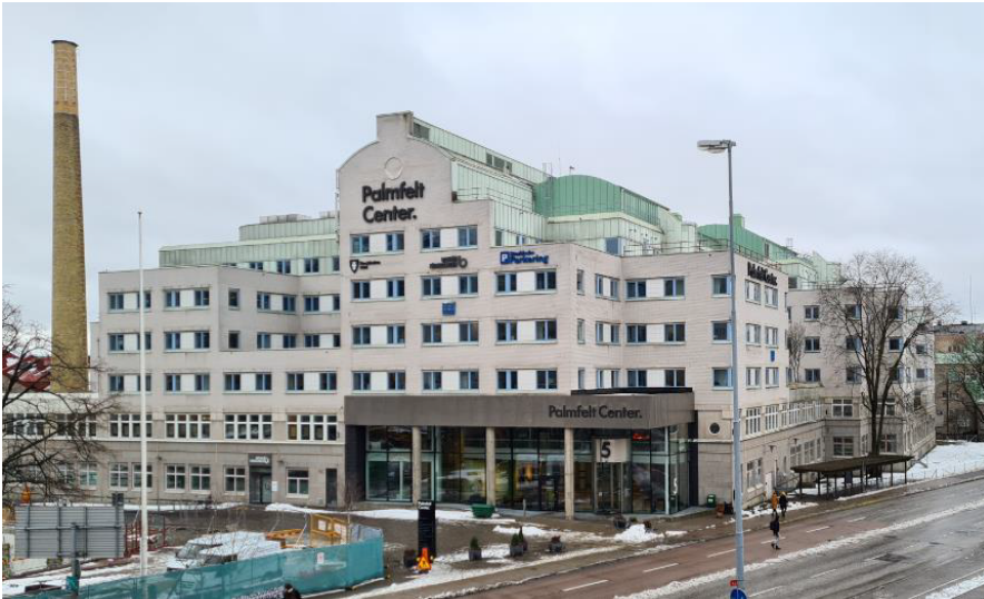
Bild på Palmfelt center