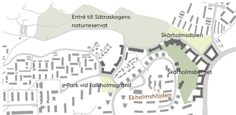
Utvecklade parkmiljöer i relation till reservatet. Bild: Nyréns Arkitektkontor

Kopplingen från Sätterskogen till Sättersdalen bevaras och utvecklas genom nya gångstråk. En kulturhistoriskt värdefull åkerholme bevaras och en ny lekplats föreslås tillkomma för att främja möten mellan nya och nuvarande Skärholmsbor.