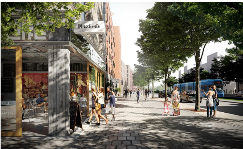
Skärholmsvägen i riktning norrut, mot Sättra. Dagens trafikled avses omvandlas till en gata med blandtrafik och ha utrymme för en framtida spårväg.

Planen möjliggör för en omvandling av Skärholmsvägen med gång- och cykelbanor som en del av gatan. En ny gata knyter ihop Gräsholmsvägen med Skärholmsvägen. Gång- och cykelnätet i parkmark bevaras delvis. Det kompletteras med gång- och cykelbanor i gatorna för ökad finmaskighet och fler trygga stråk för gående och cyklister. Två gångtunnlar (under Falkholmsgränd och Björksätravägen) tas bort när vägar flyttas och korsningar byggs om. Dessa föreslås ersättas med trafiksäkra övergångar i plan. Garage under kvarten föreslås i huvudsak som parkering för bil. Gemensamma garage föreslås vid korsningen mellan Skärholmsvägen och den nya lokalgatan. Ett garage föreslås vid korsningen Falkholmsgränd och Vårholmsbackarna.