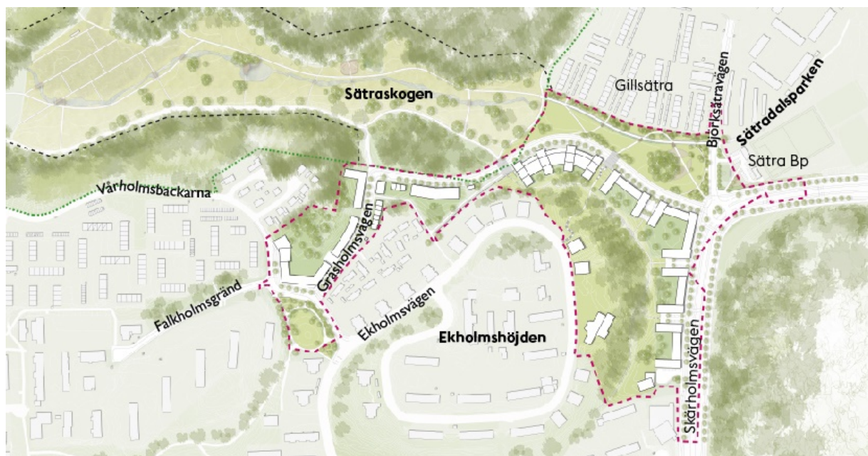
Illustrationsplan för Skärholmsdalen. Bild: Nyréns Arkitektkontor.

och tekniska anläggningar (till exempel för dagvattenhantering). Genomförandet av detaljplanen innebär att Skärholmsvägen mellan Skärholmens centrum och södra Sättra omvandlas från trafikled till stadsgata. Förslaget avser förstärka och komplettera stadsdelens karaktärsstarka gestaltning och topografi. De plana ytorna i dalen bevaras till stor del och en ny gata föreslås tillkomma för att möjliggöra bebyggelse och öka tillgängligheten inom stadsdelen och till naturreservatet. Parallellt med utbyggnaden avses också delar av stråket som förbinder Sättradalen med Sättraskogen och Mälaren utvecklas från grönområde till park.