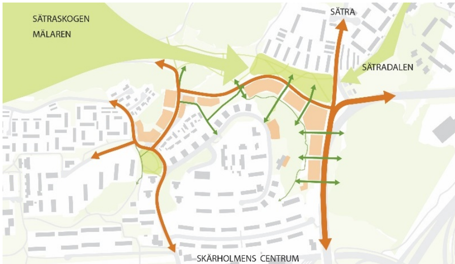
Den nya strukturen ska bidra till att stärka och utveckla kopplingar. Bild: Nyréns Arkitektkontor