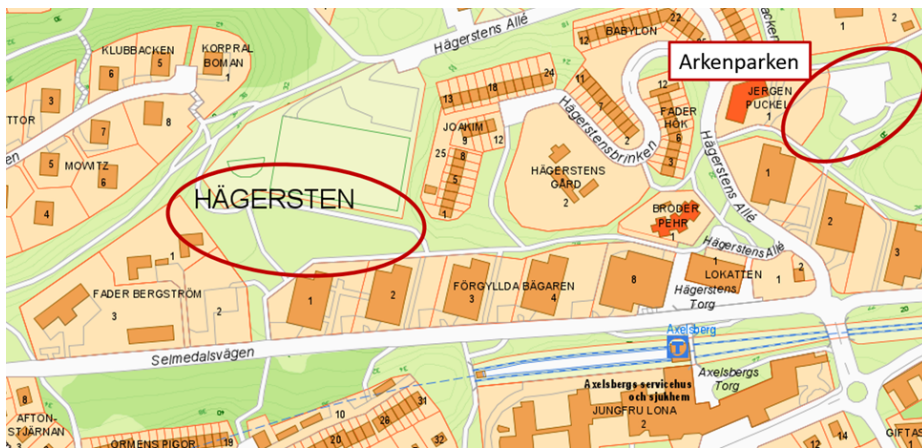
Figur 4. Områden där grönkompensationsåtgärder utförs

De kommunala anläggningarna som staden åtar sig att bygga i och med planens antagande är en ombyggnad av Selmedalsvägen, ledningsarbeten (omläggningar och en del nyförläggningar), omläggning av gångvägar. Utanför planområdet anläggs en ny branddamm då en befintlig ligger inom en blivande fastighet och måste flyttas för att möjliggöra detaljplanens genomförande. Grönkompensation i form av upprustning av park, både inom och utanför planområdet, genomförs också i och med genomförandet av projektet. Se Figur 4 för aktuella områden för grönkompensationsåtgärder.