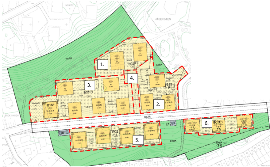
Figur 3. Byggaktörers markområden inom detaljplanen