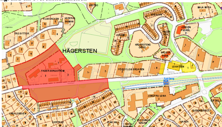
Figur 1. Karta över del av Hägersten. Röd markering visar detaljplaneområdet för Fader Bergström. Gul markering visar detaljplaneområdet för Axelsbergs centrum

Projektet med att utveckla kvarter Fader Bergström m fl i Hägersten har pågått en längre tid. Vid projektets start var idén en sammanhållen utveckling längs Selmedalsvägen med överdäckning av tunnelbanan i Axelsbergs centrum. När överdäckningsplanerna inte längre var aktuella delades projektet i två detaljplaner. En plan fokuserade på utvecklingen i Axelsbergs centrum och den andra planen har fokuserat på kvarter Fader Bergström, se Figur 1 ovan. För projekten Fader Bergström och Axelsbergs centrum togs 2019 ett gemensamt inriktningsbeslut. I och med de separata detaljplanerna och åtskilda utbyggnationen tas separata genomförandebeslut för vardera projekt. Detta genomförandebeslut berör huvudprojektet Fader Bergström och detaljplanen Dp 2015-18144.