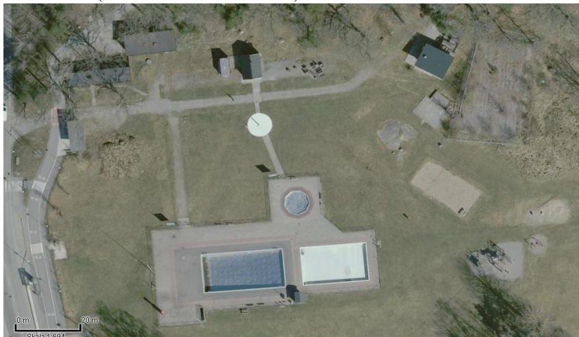
Flygfoto över Älvsjöbadet

Inriktningsbeslut fattades av fastighetsnämnden (dnr FSK 2021/409) och idrottsnämnden (Dnr IDN 5.1.1/2021/2307) i mars 2022.