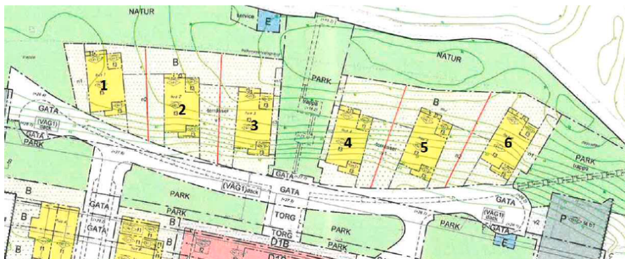
Indelning av de sex blivande fastigheterna.

Expertrådet har godkänt ärendet 2022-03-17 (dnr E2021-04838).