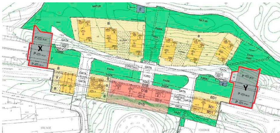
Garage X och Y.

ByggVesta kommer tillsammans med Stadsbyggen att bygga två garage, för bostäderna inom Tenstaterrassen, se bild nedan. Marken för garagen kommer att upplåtas med tomträtt med en årsavgäld på 1 000 kr per garage.